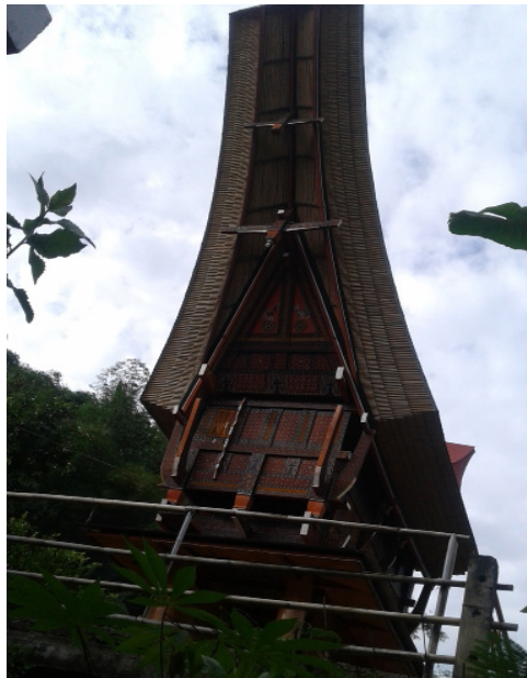
Gambar 5. Tongkonan yang tetap berdiri kokoh meskipun tanpa perekat paku

Sulawesi Selatan ini. Atap rumah tongkonan berbentuk seperti perahu lengkap dengan buritannya. Ada juga yang menganggap bentuk atap ini seperti tanduk kerbau. Pada mulanya atap rumah tongkonan sendiri dibuat dari bahan ijuk atau daun rumbia yang dianyam atau dibentuk seperti atap. Namun, saat ini penggunaan seng sebagai bahan atap lebih sering ditemukan.