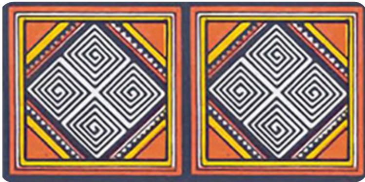
Gambar 8. Ukiran pa'salaqbi'

Salaqbi' bisa berarti 'pagar' atau 'penghalang'. Makna ukiran ini, menurut kepercayaan orang Toraja, benda untuk melindungi keluarga dari hal-hal negatif, seperti niat jahat seseorang atau untuk menangkal penyakit. Diharapkan manusia bisa menjaga diri atau mencari pengetahuan untuk bisa mempertahankan diri dari pengaruh kehidupan yang begitu banyak cobaan.