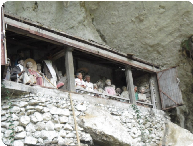
Gambar 21. Patung yang berjejer di area pemakaman

Dalam adat istiadat Tana Toraja, masyarakat mempercayai bahwa setelah kematian masih ada sebuah dunia, tempat arwah para leluhur berkumpul. Masyarakat Toraja menyebut dunia abadi itu sebagai puya , yang berada di sebelah selatan Tana Toraja. Di puya inilah, arwah yang meninggal akan bertransformasi menjadi bombo (arwah gentayangan), to mebali puang (arwah setingkat dewa), atau dewata (arwah pelindung).