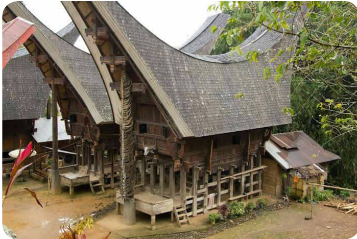
Gambar 2. Tongkonan Tana Toraja

Pada dasarnya terdapat beberapa pendapat tentang asal kata Toraja, di antaranya istilah orang Bugis yang menyebut to riaja , yang berarti ‘orang yang berdiam di negeri atas’. Namun, orang Luwu menyebutnya to riajang yang artinya adalah ‘orang yang berdiam di sebelah barat’. Ada juga pendapat lain yang mengatakan bahwa kata toraya berasal dari dua kata, yakni to yang berarti tau ‘orang’, dan raya yang berasal dari kata maraya yang berarti ‘besar’ atau ‘bangsawan’.