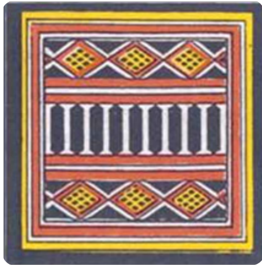
Gambar 10. Ukiran pa'lamban lalan