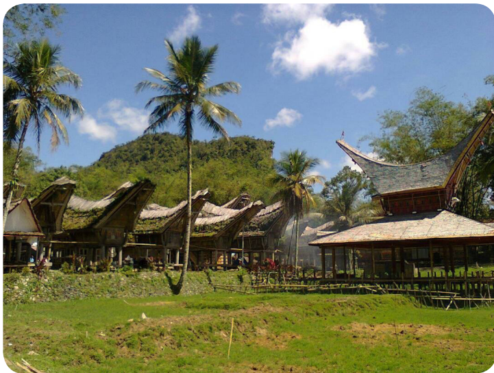
Gambar 1. Pemandangan tongkonan Tana Toraja (dok. pribadi)

Adik-adik, kalian pasti sudah sering mendengar cerita tentang Tana Toraja, 'kan? Ya, karena Tana Toraja adalah salah satu daerah tujuan wisata di Indonesia. Tana Toraja merupakan salah satu kabupaten yang terdapat di Provinsi Sulawesi Selatan.