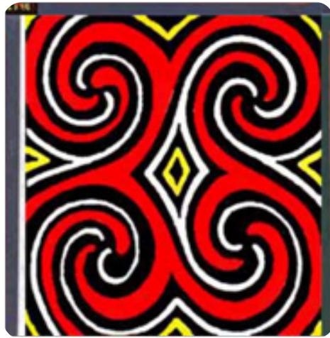
Gambar 13. Ukiran pa'barana'