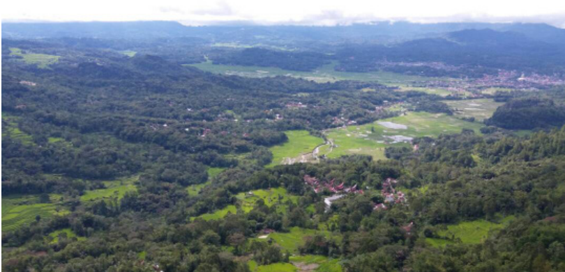
Gambar 3. Permukiman masyarakat Tana Toraja

Wilayah permukiman mayoritas suku Toraja dikenal dengan sebutan Tana Toraja. Tana Toraja merupakan salah satu di antara 24 daerah tingkat II atau kabupaten yang terdapat di Provinsi Sulawesi Selatan.