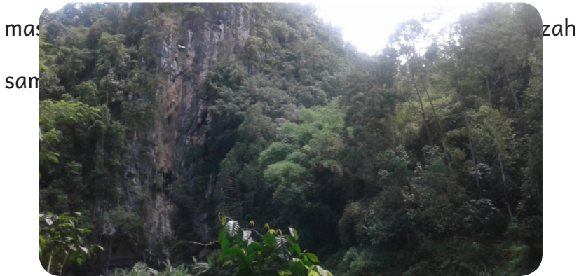
Gambar 22. Salah satu tebing yang dijadikan sebagai tempat pemakaman oleh masyarakat Suku Toraja

akan diarak dan diantar ke pemakaman yang terletak di dinding tebing. Biasanya, akan dibentangkan kain merah yang panjang dengan peti jenazah berada di paling belakang. Tak hanya dari pihak keluarga, seluruh