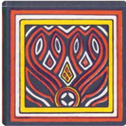
Gambar 15. Ukiran pa'tanduk re'pe

Adik-adik, tampaknya ukiran-ukiran yang ada di Tana Toraja cantik-cantik, 'kan? Pantaslah kalau Tana Toraja menjadi salah satu daerah tujuan wisata di Indonesia. Selain warna ukirannya yang agak cerah, ukiran tersebut juga mempunyai makna, lho . Jadi, tidak asal diukir saja, ya. Masyarakat di Tana Toraja meyakini hal itu sehingga ukiran tersebut masih terjaga sampai sekarang.