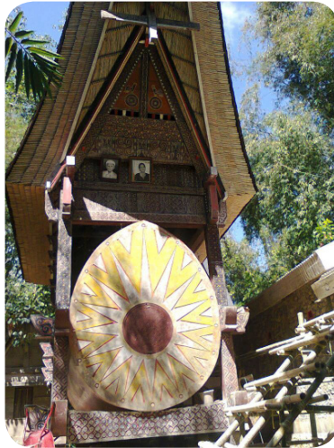
Gambar 18. Tongkonan yang dijadikan sebagai tempat penyimpanan jenazah

Setelah pihak keluarga mampu menyediakan hewan kurban tersebut, barulah rambu solo dilaksanakan. Jenazah dipindahkan dari rumah duka ke tongkonan tammuon ( tongkonan pertama tempat dia berasal). Di sana dilakukan penyembelihan satu ekor kerbau sebagai kurban atau dalam bahasa Torajanya ma'tinggoro tedong . Kerbau yang akan disembelih ditambatkan pada sebuah batu yang diberi nama simbuang batu .