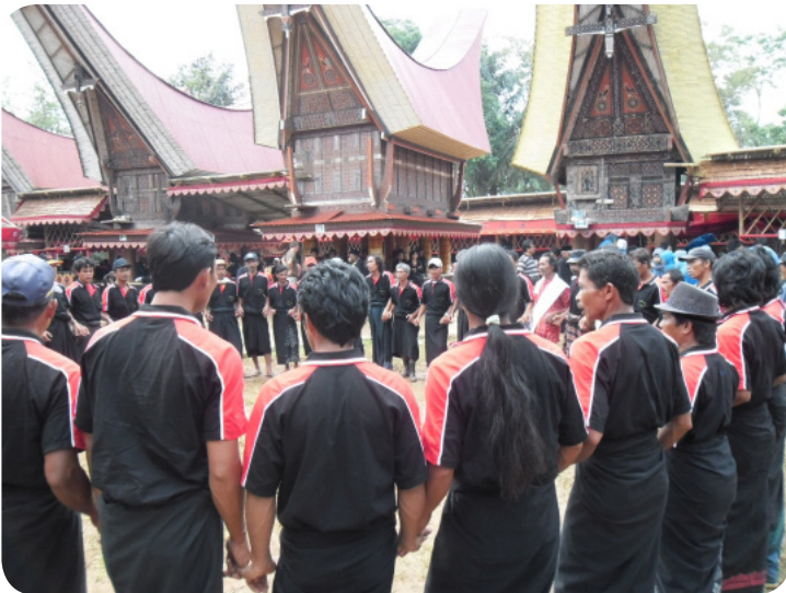
Gambar 19. Persiapan acara kematian Rambu Solo

Prosesi pengarakan jenazah dari tongkonan barebatu menuju rante (lapangan khusus tempat prosesi berlangsung) dilakukan setelah kebaktian dan makan siang. Para lelaki mengangkat keranda tersebut, sedangkan wanita bertugas menarik lamba-lamba .