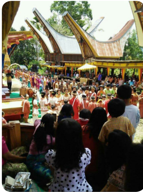
Gambar 16. Prosesi acara rambu solo yang dilaksanakan dengan meriah

waktu dua sampai tiga hari, bahkan dua minggu bagi kalangan bangsawan.