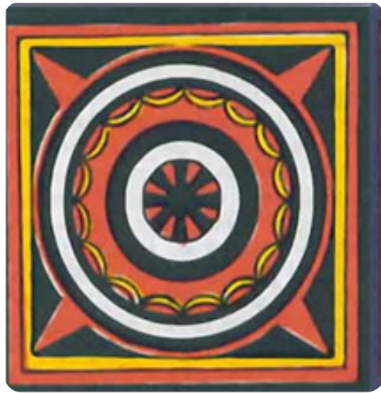
Gambar 14. Ukiran ne' limbongan