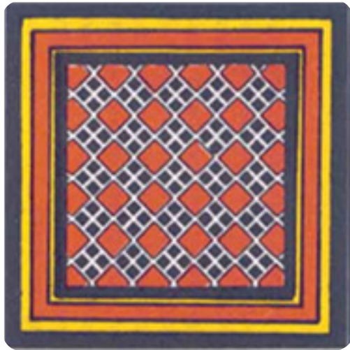
Gambar 11. Ukiran pa'ara'