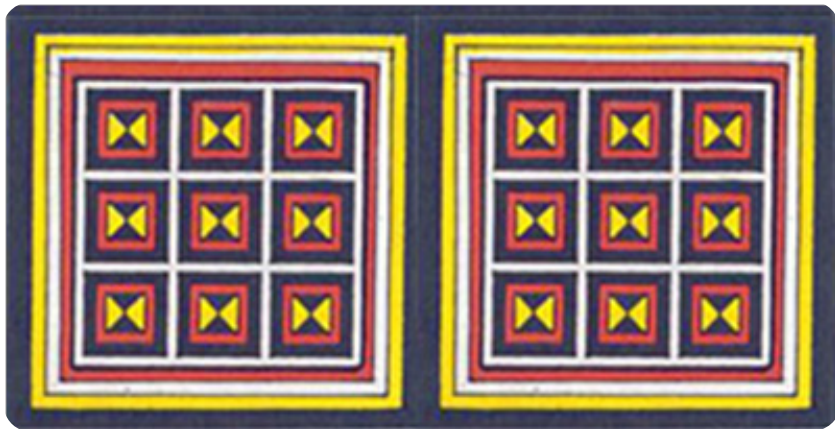
Gambar 9. Ukiran pa'dadu

sebagian masyarakat. Adapun makna dari ukiran ini adalah peringatan kepada anak cucu agar jangan bermain dadu atau judi karena permainan ini sangat berbahaya.