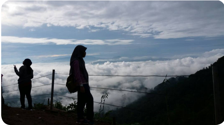
Gambar 4. Puncak Lolai yang dijuluki masyarakat sebagai Negeri di Atas Awan

di atas awan yang bernama Lolai. Di puncak Lolai, kita dapat memandangi gumpalan-gumpalan awan di bawah kita. Tempat wisata ini sangat terkenal, Iho . Lihatlah gambar di bawah ini! Hmmm... indah sekali, bukan?