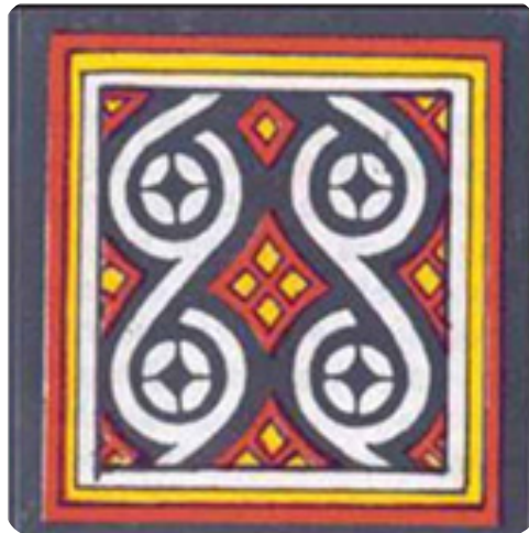
Gambar 12. Ukiran pa'kangkung