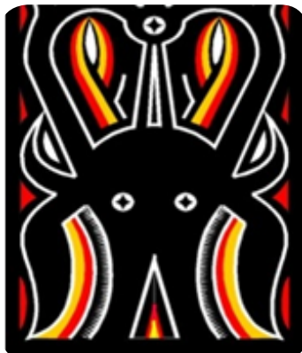
Gambar 6. Ukiran pa'tedong