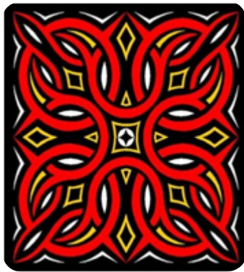
Gambar 7. Ukiran pa'kapu' baka

Ukiran pa pa'kapu baka artinya ukiran yang menyerupai simpulan-simpulan penutup bakul. Ukiran ini juga merupakan salah satu ukiran yang sering digunakan. Bakul yang dimaksud pada ukiran ini adalah bakul yang sering digunakan orang Toraja sebagai tempat menyimpan harta benda. Makna filosofis dari ukiran ini adalah sebagai tanda harapan agar keluarga senantiasa hidup rukun, damai, sejahtera, dan bersatu padu bagaikan harta benda yang tersimpan dengan aman dalam bakul.