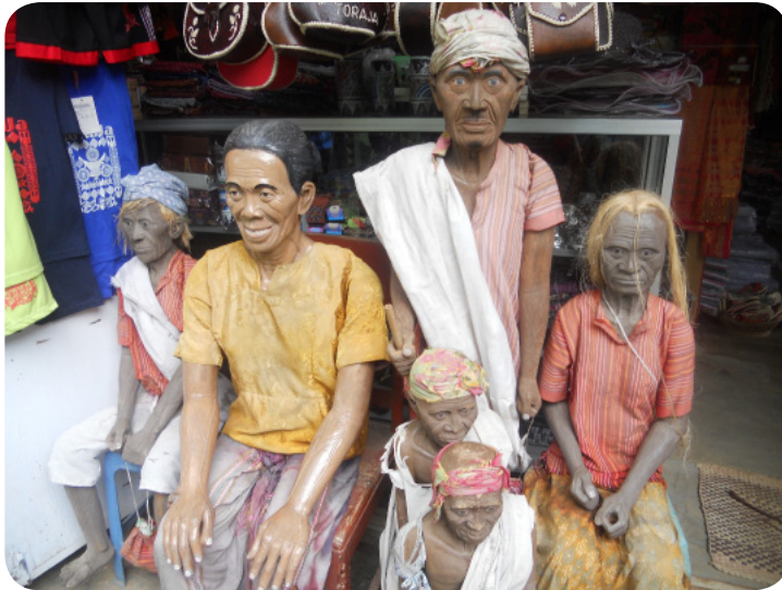
Gambar 17. Patung yang dibuat menyerupai wajah orang yang telah meninggal

Jika keluarga mendiang belum mampu melaksanakan upacara rambu solo , jenazah itu akan disimpan di tongkonan (rumah adat Toraja) sampai pihak keluarga mampu menyediakan hewan kurban untuk melaksanakan upacara tersebut. Jenazah bisa disimpan di dalam tongkonan itu selama bertahun-tahun.