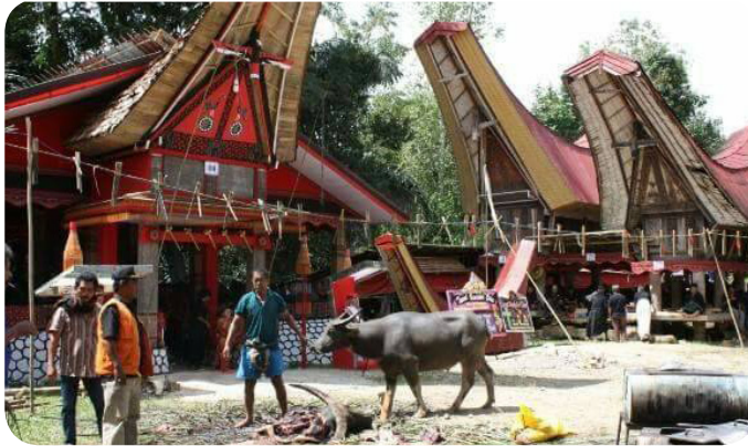
Gambar 20. Kerbau yang akan dipersembahkan pada acara rambu solo

di patane' , yaitu kuburan dari kayu berbentuk rumah adat.