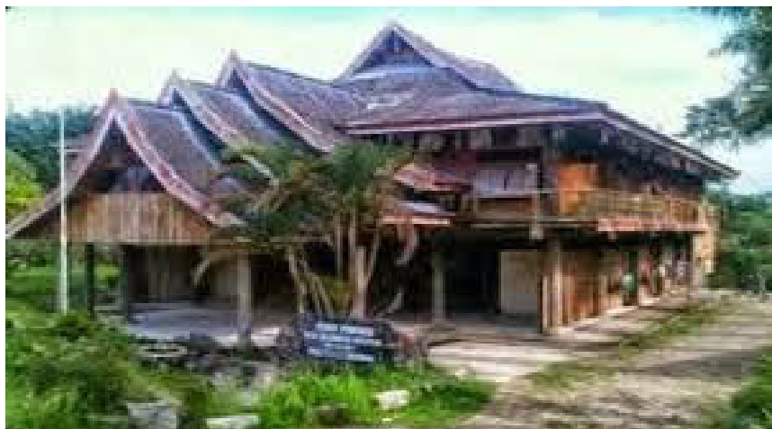
Rumah Adat Suku Tolaki Laika Taba Kataba

pada pembagian kepercayaan alam dan pembagian yang mengacu pada analogi tubuh. Tampak dari atas bagian depan rumah adat Tolaki, dilambangkan sebagai tangan kanan dan kiri serta tengahnya dagu. Bagian tengah diumpamakan dua lutut dan tengahnya tali pusar. Pada bagian belakang dilambangkan dua kaki kiri dan kanan, sementara tengah ibarat alat vital.