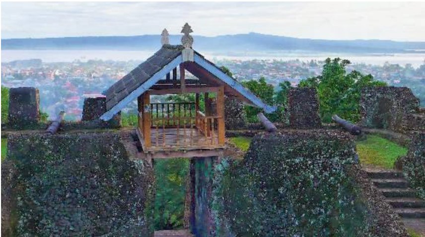
Gambar benteng Keraton Buton.

Dari hasil itulah masyarakat nusantara kemudian meniru dan membangun benteng-benteng saat mempertahankan daerahnya. Beberapa bukti, benteng merupakan sebuah kejayaan pada masa lalu.