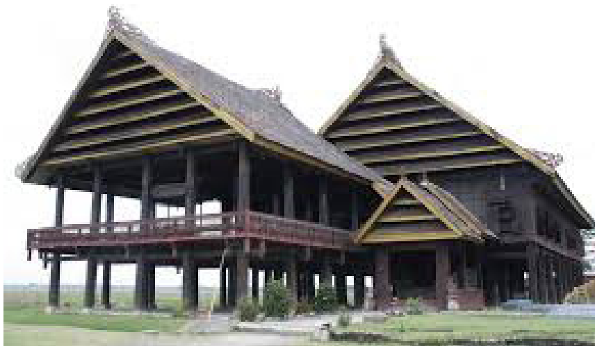
Rumah adat Suku Bugis

Adat istiadat Bugis di daerah lain juga tidak jauh berbeda dengan Bugis pada daerah asalnya. Begitu juga pada bentuk rumah yang dimiliki suku Bugis yang mendiami daerah lain sebagian masih mempertahankan rumah panggung tempat mereka berasal. Ternyata ada keunikan pada asal mula rumah adat suku Bugis, yaitu rumah tanpa menggunakan paku atau besi sebagai penahan. Diperkirakan pada zaman dahulu masyarakat Bugis belum banyak mengenal alat pertukangan. Bugis baru mengenal mata bor manual, gergaji, pahat, dan parang. Alat-alat pertukangan pun diperoleh dari sistem barter dari daerah tempat para pedagang Bugis singgah.