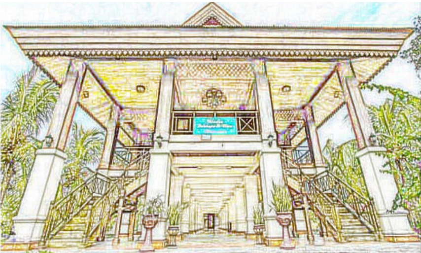
Rumah Adat Dulohupa Gorontalo

Rumah ini dilengkapi dengan dua tangga, yaitu tangga yang berada di bagian kiri dan kanan rumah yang menjadi simbol tangga adat atau disebut tolitihu . Pada zaman kerajaan rumah adat ini dibuat berdasarkan simbol pengabdian ikrar persatuan dua kerajaan Raja Gorontalo dan Limboto. Banyak versi atas simbol-simbol yang ada pada artistik rumah adat.