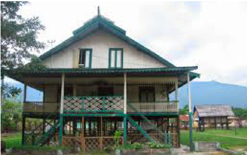
Rumah Adat Sauroja Sulawesi Tengah

Rumah Souraja yang ada hingga kini tersebut memiliki 36 tiang penyangga rumah. Souraja yang terletak di kota Palu ini pula disekat menjadi empat ruang, yakni ruang utama, tengah, bagian belakang, dan satu kamar utama. Sementara itu, untuk dapur dibuat sendiri di bagian belakang yang dihubungkan dengan jembatan yang diberi atap.