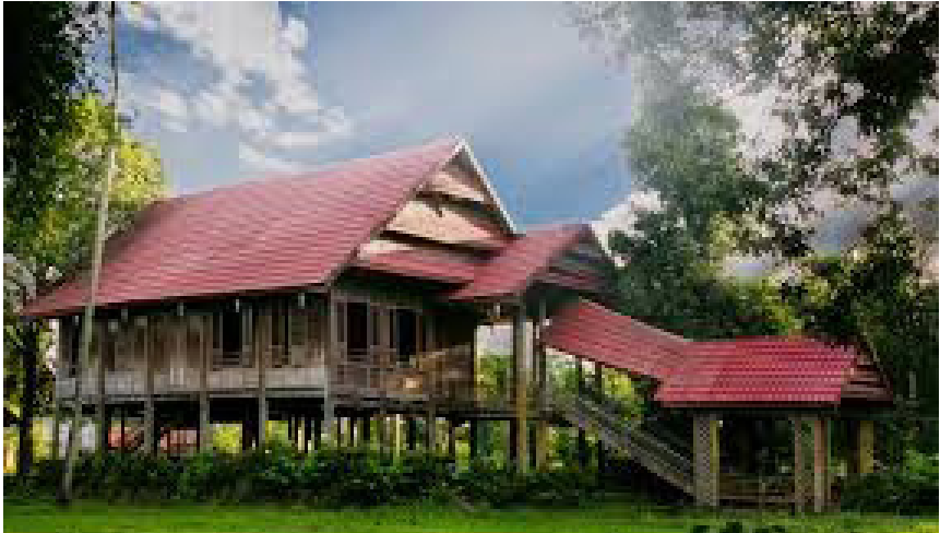
Rumah Adat Luwu

Bagian selanjutnya dari rumah adat Luwu ialah ruangan terakhir yang merupakan ruangan dua kamar berukuran kecil, lebih kecil dari dua kamar yang berada di ruangan sebelumnya.