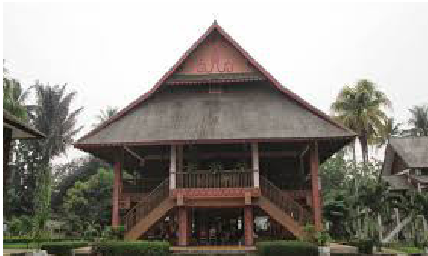
Rumah adat Walewangko/Pewaris.

sebagai tempat untuk menjamu tamu wanita dan juga tempat anggota keluarga melakukan aktivitas sehari-harinya. Bagian ini pada umumnya bersambung langsung dengan dapur, tempat tidur, dan juga tempat makan. Jika dicermati, keunikan rumah pewaris ini terletak dari arsitektur depan rumah. Perhatikan saja susunan tangga yang berjumlah dua dan terletak di bagian kiri dan kanan rumah.