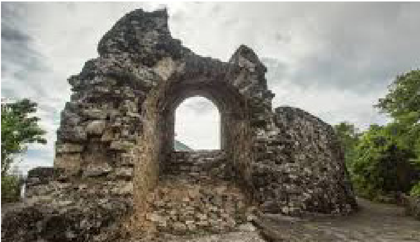
Benteng Otanaha Gorontalo dibuat dari campuran telur burung maleo

Benteng Otanaha terletak di Kota Gorontalo, tepatnya di Kelurahan Dembe. Benteng ini dibangun pada zaman Portugis semasa kerajaan Ilato. Benteng dibuat atas 3 bangunan terpisah. Berdasarkan sejarah tiga benteng tersebut masing-masing Otanaha, Otohiya, dan Ulupahu. Penamaan benteng tersebut ternyata diambil dari 3 orang putra Raja Ilato. Benteng tersebut dibangun pada abad 15 dengan pengaruh arsitektur Portugis dengan menghadap