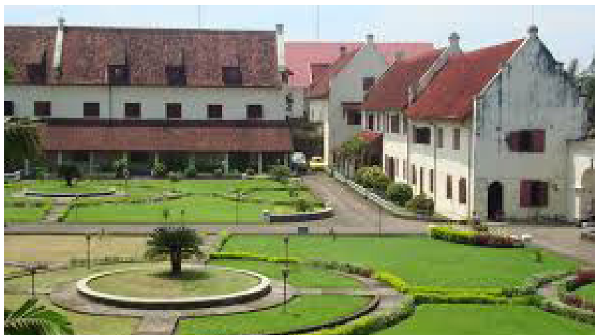
Benteng Fort Rotterdam Makassar.

Sultan Hasanuddin tidak dapat lagi mempertahankannya, karena posisinya yang strategis, Belanda kemudian membangun Benteng Ujung Pandang dengan penataan sesuai dengan arsitektur Belanda. Di dalam area benteng terdapat beberapa bangunan sebagai pusat pemerintahan. Sejak saat itu, nama benteng pun berubah menjadi Fort Rotterdam . Pemberian nama pun berdasarkan kelahiran pimpinan Kolonial Belanda, yakni Cornelis Speelman di Belanda.