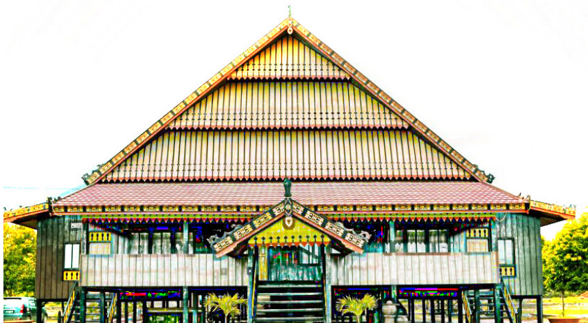
Rumah adat Mekongga Kolaka

Bentuk rumah adat Mekongga adalah sebuah replika yang digunakan pada masa kerajaan Raja Latambaga. Konon Raja Latambaga mendirikan sebuah rumah sebagai balai pertemuan para pemangku adat. Berbentuk panggung dan tidak ada sekat sama sekali. Pada masa Kerajaan Latambaga semua peralatan pertukangan pun sudah maju, hal ini dibawa oleh pedagang dari Luwu yang lebih dahulu maju. Rumah pertemuan tersebut dikerjakan bersama-sama, mulai pengambilan kayu hingga atap yang terbuat dari daun rumbia. Pada akhirnya rumah tersebut dimakan usia dan tidak diperbaharui lagi. Hanya ada sebuah dokumen foto rumah pada zaman Belanda.