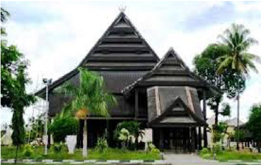
Rumah adat Balla atau Bola (Makassar)

Sejarah Makassar mencatat faktor yang membedakan rumah bangsawan lebih megah daripada masyarakat biasa karena bangsawan lebih berpengaruh dan disegani oleh masyarakat biasa. Ketika meminta tolong kepada masyarakat biasa, masyarakat tersebut menganggap dirinya juga dihargai. Hal inilah yang menyebabkan rumah adat bangsawan Makassar lebih besar dibandingkan masyarakat biasa.