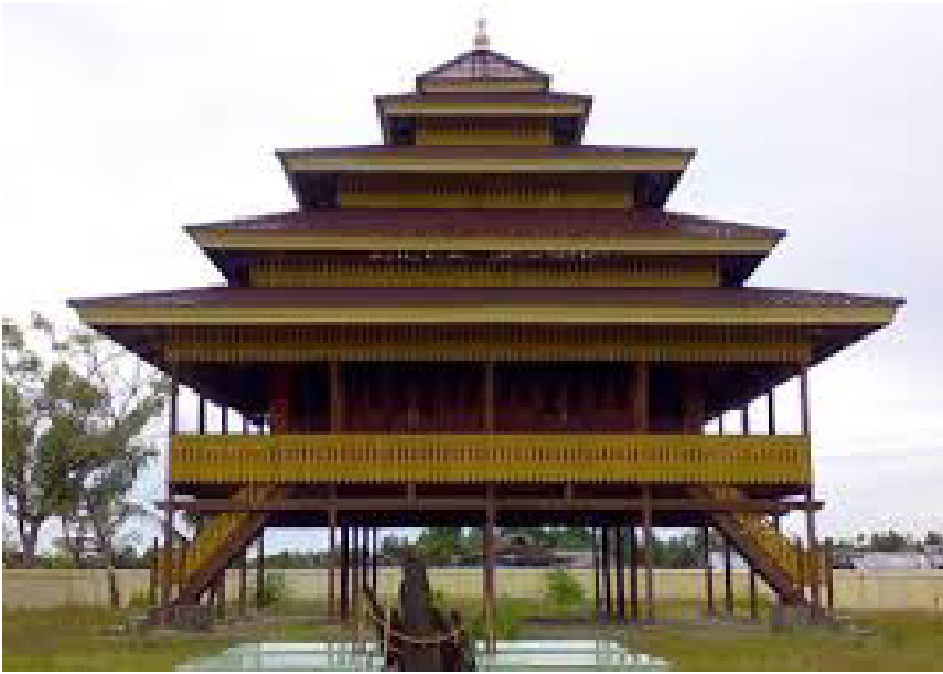
Rumah Adat Balle Dako Istana Kerajaan Tolitoli