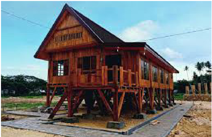
Rumah adat Suku Muna “Bharuga Wuna” Sulawesi Tenggara

empat kampung inilah dijadikan pusat pemerintahan yang berpindah-pindah. Hal ini diyakini pula pada setiap kampung dibuat sebuah bangunan, sebagai tempat pertemuan adat. Namun, sampai saat ini, tidak ada yang menguatkan hal tersebut. Sementara itu, rumah adat yang dibangun, terinspirasi dari rumah masyarakat Muna zaman dahulu yang sederhana dan terkesan apa adanya. Akan tetapi, dapatlah dibayangkan bahwa Masyarakat Muna pada masa kerajaan sudah mengenal arsitektur sederhana.