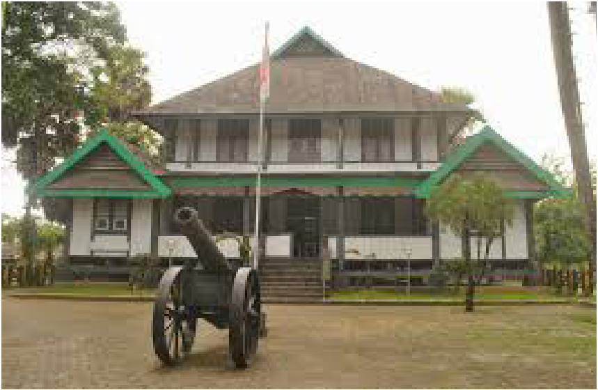
Bangunan Utama pada Benteng Somba Opu hasil rekonstruksi Gowa Makassar.

kilometer, tinggi 7 hingga 8 meter, dan luasnya sekitar 1.500 hektar. Dari beberapa puing-puing di dalam benteng, diperkirakan terdapat beberapa bangunan utama. Dari hasil riset inilah kemudian benteng Somba Opu dibangun kembali dan di tengahnya dibangun beberapa rumah adat Sulawesi Selatan.