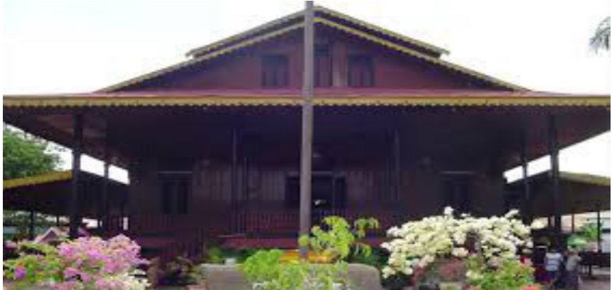
Rumah adat Rumah Adat Bantayo Poboide Limboto Gorontalo

sebagai tempat digelarnya upacara adat, penerimaan tamu kenegaraan, pesta perkawinan adat, kegiatan sosial, dan kegiatan keagamaan. Sejarah artistik pembuatan rumah adat ini diambil dari tatanan masyarakat setempat. Simbol pada bentuk desainnya sudah dirancang sedemikian rupa sehingga memberikan makna tersendiri.