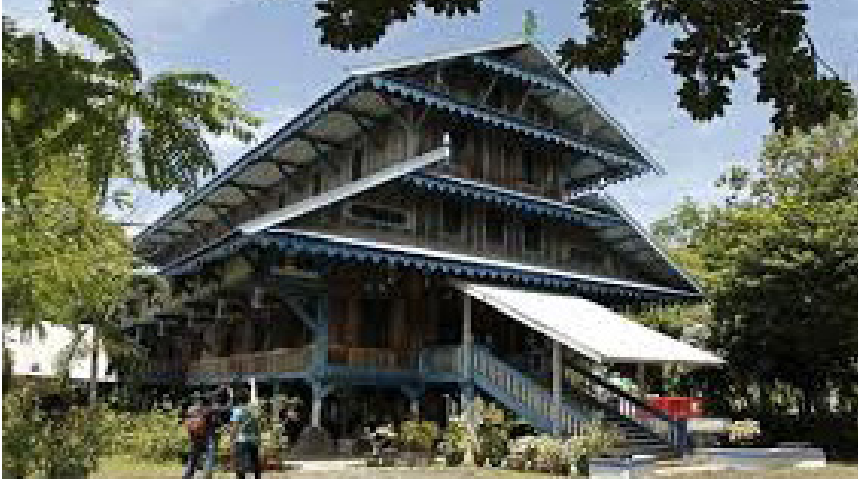
Rumah Adat Malige Sulawesi Tenggara

mulai tumbuh di daerah Buton. Hal ini dikarenakan Buton menjadi tempat persinggahan kapal-kapal pedagang. Tidak mengherankan alat-alat pertukangan diyakini juga masuk pada zaman tersebut.