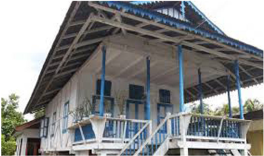
Rumah adat Komalik dan Silidan