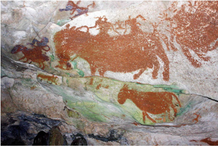
Hasil karya prasejarah yang ditemukan di Maros

Kedua gambar tersebut adalah bukti prasejarah peradaban di Sulawesi yang belum mengenal tempat tinggal atau rumah. Akan tetapi, mereka sudah mengenal cara menggambar walau hanya dengan menggunakan pewarna alam. Seiring berkembangnya pengetahuan, manusia prasejarah mengenal konsep rumah tinggal.