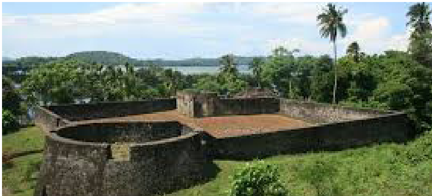
Benteng Orange Kwadang Gorontalo Utara

para perompak. Benteng Oranye sendiri diketahui keberadaanya setelah kemerdekaan. Lembaran sejarah yang menjelaskan tentang benteng Oranye pun sedikit. Catatan sejarah yang melakukan penelitian di Belanda, juga tidak menemukan asal mula didirikan benteng tersebut.