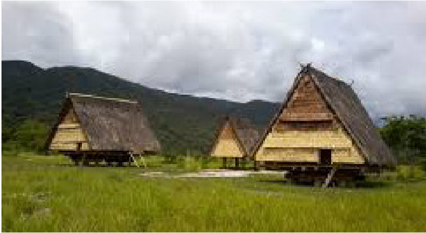
Rumah Adat Tami Sulawesi Tengah

dikenal kuat atau kulit kayu waru. Kayu yang digunakan untuk mendirikan rumah ini adalah kayu pilihan yang dinilai bisa tahan lama dan tidak bisa dimakan rayap.