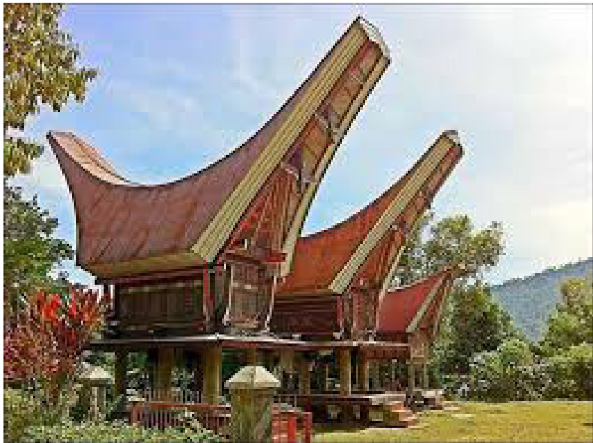
Rumah Adat Tongkonan Toraja

adat Tongkonan juga dapat tahan hingga ratusan tahun. Rahasia dibalik kokohnya rumah adat ini adalah bahan. Bahan dasarnya kayu pilihan atau kayu aru atau kayu besi yang umurnya juga dapat dibilang puluhan tahun. Pengambilan pohon sebagai bahan dasar rumah pada saat itu, diambil secara adat. Hal ini pula sebagai penghargaan kepada alam. Bukti bahwa rumah adat Tongkonan yang masih berdiri kokoh dan diperkirakan umurnya sudah kurang lebih 700 tahun dan beratapkan batu, berada di Desa Banga Kecamatan Rembon Kabupaten Tana Toraja.