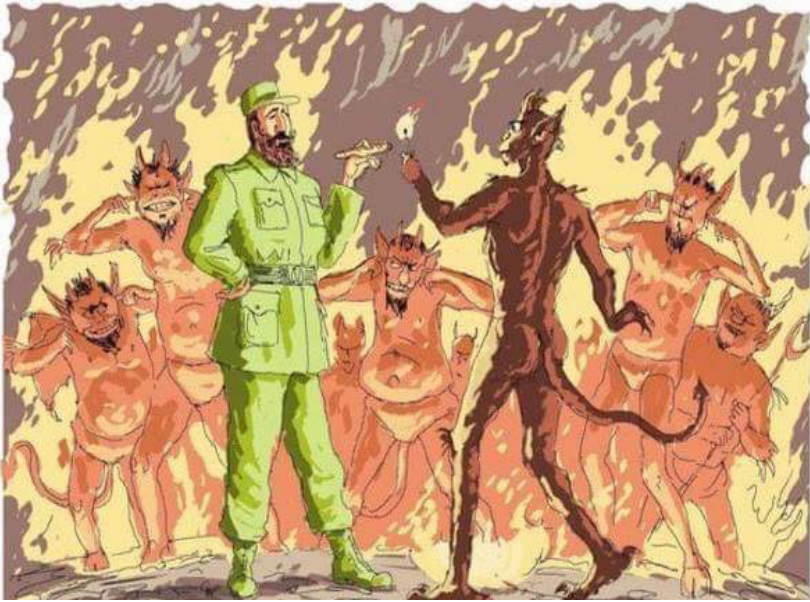
Fidel Castro dan Setan, Salah Satu Mural di Sudut Jalanan Mexico City

Selama di Mexico City aku tinggal di sebuah apartemen di Polanco V, di jalan Lago Onega, dekat pabrik bir Corona dan sebuah persimpangan yang sibuk antara av Ejercito Nacional dan Calle Arquimedes. Di tempat itu terdapat toko serba ada, Oxxo, dan sebuah restoran cepat saji Amerika di seberangnya. Di Meksiko laluan kecil disebut lago, lebih besar sedikit disebut calle, dan yang sangat besar disebut av. Jalan-jalan kecil ini tidak sama seperti gang-gang sempit di Jakarta, lebarnya cukup dilalui empat mobil pada saat yang bersamaan, tapi berbeda dengan av yang memiliki pembatas jalan untuk arah yang berlawanan.