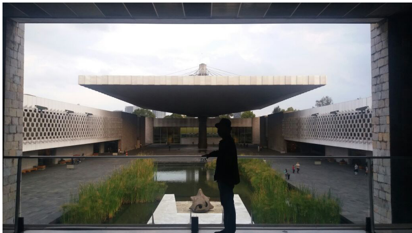
Museum Nacional de Antropologia

Aku duduk di sana dan menikmati secangkir kopi. Suasana di kafe ini remang, sebuah tempat yang sempurna untuk membicarakan sebuah persekongkolan Beberapa orang tua kulit putih dengan kumis melintang memenuhi kafe ini. Gambar sang diktator tidak hanya terpampang di dinding, tapi juga di menu dan cangkir. Boleh jadi kafe ini dibangun oleh pemuja Diaz, sebagaimana di Indonesia pun masih ada sebagian kecil orang yang memuja Soeharto dan merindukannya. Akan tetapi mungkin aku keliru, karena ketika aku berpindah tempat keluar ingin mengisap sebatang rokok, aku melihat keset kaki di pintu juga bergambar wajah sang diktator. Ketika malam tiba, dari arah timur Monumen Revolusi disinari cahaya biru. Aku membayar kopi, melewati sekali lagi Monumen Revolusi dan berpapasan lagi dengan seorang perempuan berbaju pengantin yang kedinginan setelah menyelesaikan sesi pemotretan, mungkin untuk foto-foto prapernikahan.