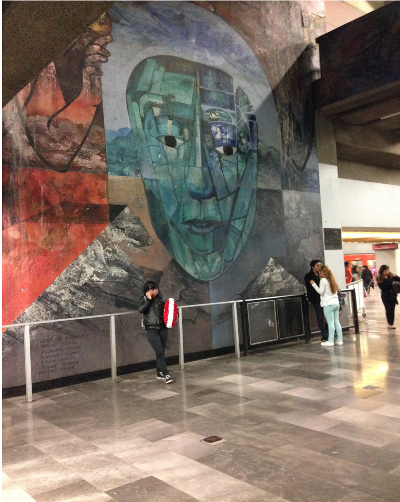
Sebuah Sudut Metro Di Mexico City