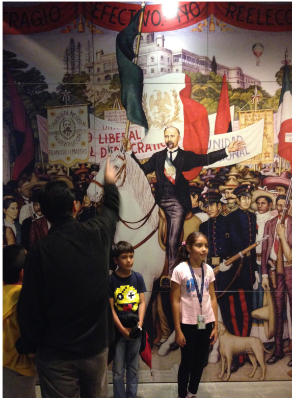
Salah Satu Mural Museo Nacional de la Revolución, Mexico City

membayar sekitar 30 pesos, setengah dari harga hari biasa, dan itulah ternyata penyebab panjangnya antrian. Aku memilih antrian kedua, aku ingin melihat museum. Di kirikan hanggar menuju pintu museum terdapat beberapa buah kafe dan toko suvenir, bentuknya seperti kubus, jika bukan seperti kontainer. Dibandingkan museum-museum lain, seperti Museum Antropologia yang tidak habis dikunjungi sehari atau Museum Temple de Mayo, museum revolusi tidak terlalu besar. Hanya perlu waktu dua jam untuk melihat seluruh isi museum.