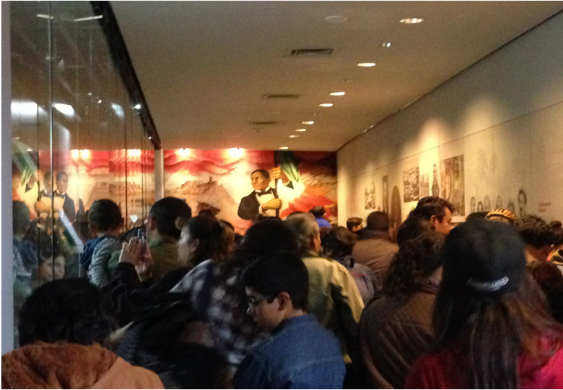
Susana Museo Revolucion pada Hari Revolusi Meksiko

Museum Revolusi tidak tampak dari seberang jalan. Terhalang oleh sebuah monumen dengan kubah melengkung. Monumen ini tidak terlalu tinggi. Mengelilingi monumen ini adalah bulevar yang cukup luas setinggi sekitar tujuh anak tangga. Ada banyak keluarga menghabiskan waktu bercengkerama di bulevar ini. Beberapa pasangan berciuman. Aku pikir, apa yang lebih tepat dan berkesan selain merayakan hari revolusi dengan bertukar ciuman. Sementara, seorang pengantin perempuan sedang memperbaiki riasannya. Lalu aku menuju museum yang berada di lambung monumen. Di pintu museum sudah tampak dua baris antrian. Yang satu cukup panjang. Petugas museum mengatakan hari ini museum gratis, bahkan untuk orang asing. Tapi kalau aku ingin naik lift dan mencapai kubah revolusi, aku harus