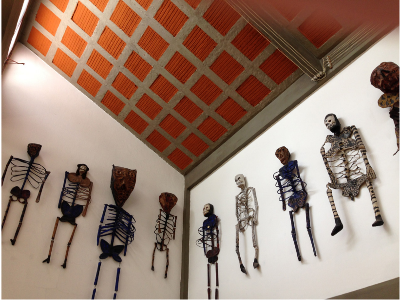
Pajangan di Dinding Museo Casa Estudio Diego Rivera and Frida Kahlo

rupa modern Meksiko. Setelah membeli tiket masuk dan tiket untuk memotret, aku diarahkan oleh seorang petugas untuk naik ke lantai dua.