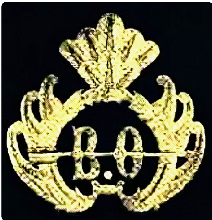
Lambang organisasi Budi Utomo (Boedi Oetomo)

kongres itu, Dokter Wahidin kembali mengemukakan gagasannya. Dia mengemukakan bahwa sangat penting untuk mengambil hal yang baik dari budaya Eropa dan meninggalkan hal yang buruk dari adat sendiri. Namun, adat dan budaya sendiri yang baik, tentu saja, harus dilestarikan. Lalu, Dokter Wahidin juga membangkitkan semangat hadirin. Dia menyatakan, “Orang-orang Jawa sedang menyongsong hari depan yang indah.” Kata-kata itu benar-benar menggugah semangat peserta kongres.