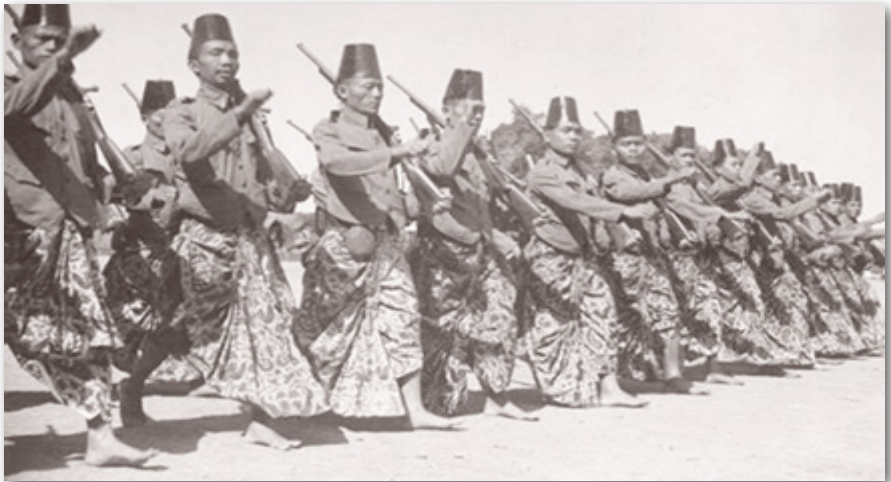
Gambar 13: Abdi Dalem di Masa Lalu

Setelah diproklamasikan pada 13 Maret 1755, Keraton Ngayogyakarta Hadiningrat membutuhkan aparatur negara, baik dari golongan sipil maupun militer. Abdi dalem merupakan aparatur sipil, sedangkan aparatur militernya adalah prajurit keraton. Abdi dalem bertugas sebagai pelaksana operasional di setiap organisasi yang dibentuk oleh sultan. Tanpa adanya abdi dalem, roda pemerintahan keraton tidak akan bisa berjalan. 2