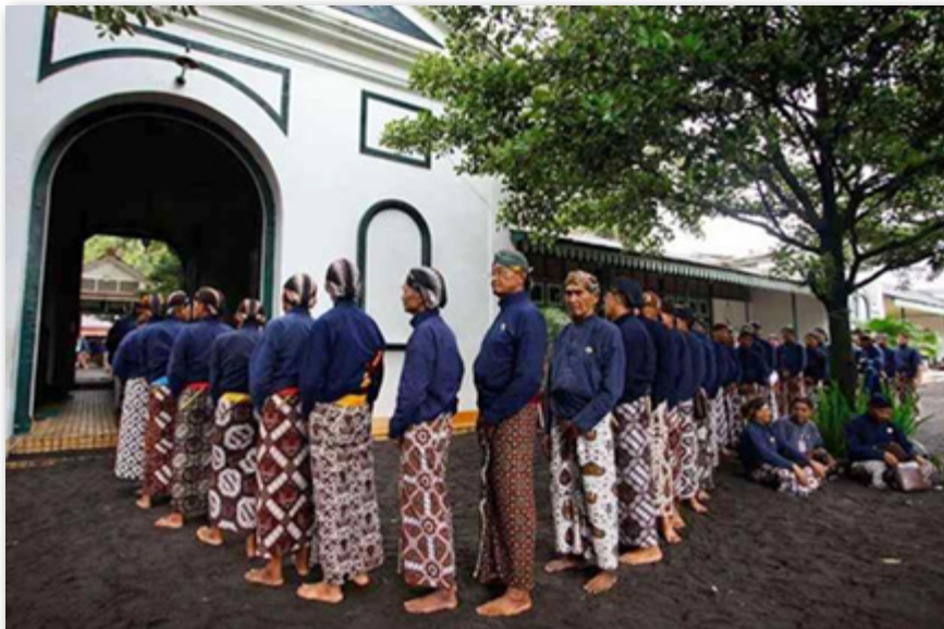
Gambar 17: Para Abdi Dalem Saat Diwisuda

diwisuda, abdi tersebut menjabat abdi dalem paling rendah, yaitu jajar . Dalam kurun waktu tertentu, jajar akan mendapatkan gelar atau tingkatan sesuai dengan waktu atau darma baktinya, misalnya bekel anom , bekel sepuh , lurah , dan lain-lain.