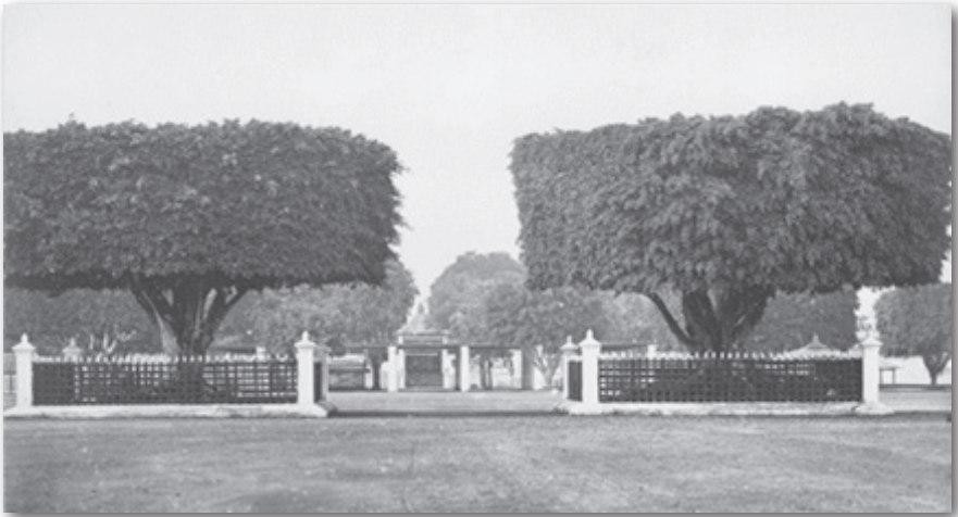
Gambar 2: Keraton Dilihat dari Alun-Alun Utara (1857)

Keraton Kesultanan Yogyakarta didirikan oleh Sultan Hamengku Buwana I, beberapa bulan setelah Perjanjian Giyanti. Konon, pada awalnya lokasi ini merupakan bekas pesanggrahan bernama Garjitawati. Pesanggrahan ini dulunya digunakan untuk istirahat iring-iringan para pengantar jenazah raja-raja Mataram (Kartasura dan Surakarta) yang akan dimakamkan di Imogiri.