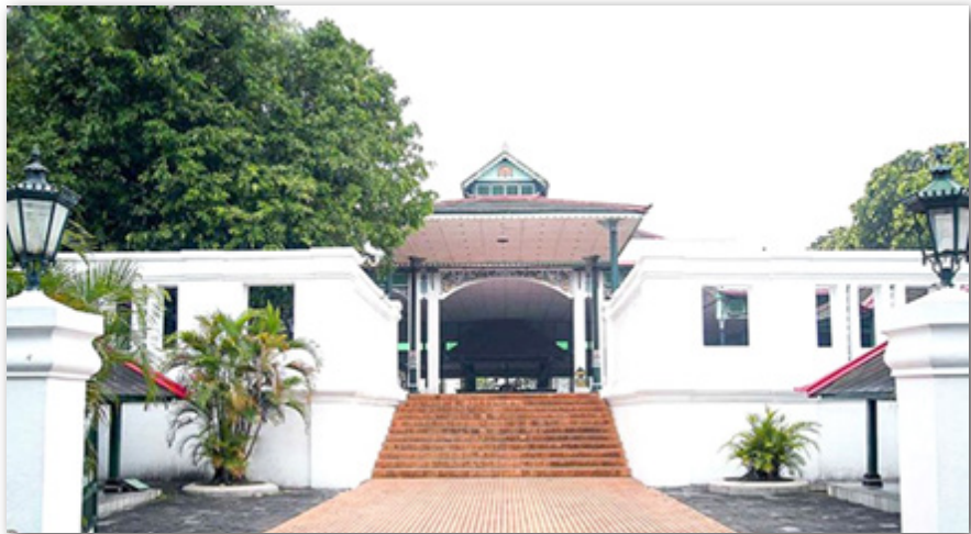
Gambar 7: Gedhong Sasana Hinggil Dwi Abad

Sebenarnya, bahasan tentang Keraton Yogyakarta masih sangat panjang. Namun, berhubung keterbatasan ruang dan agar tema bahasan tidak melebar, saya sudah sampai di sini. Selanjutnya, kita akan membahas tema inti, yaitu abdi dalem Keraton Yogyakarta.