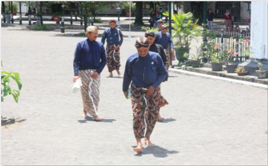
Gambar 10: Para Abdi dalem Menuju Tempat Tugas

Lalu, apa itu Abdi Dalem Keprajan? Mereka adalah abdi yang berasal dari golongan TNI, Polri, dan pegawai negeri sipil. Pada umumnya, Abdi Dalem Keprajan adalah orang-orang yang telah memasuki masa pensiun. Mereka kemudian mendarmabaktikan waktu, ilmu, dan tenaganya untuk membantu keraton secara suka rela. 1