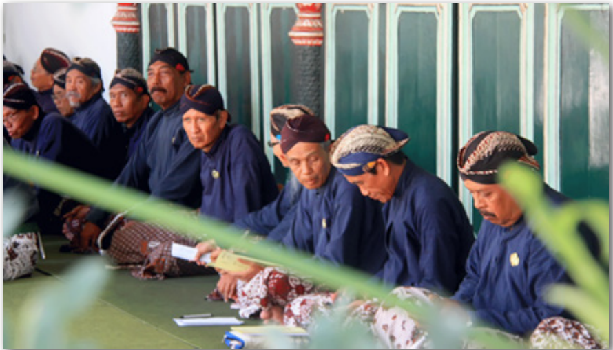
Gambar 11: Abdi Dalem Sedang Rapat Suatu Acara

Dilihat dari lingkup pekerjaannya, abdi dalem yang paling dekat dengan sultan adalah Abdi Dalem Keparak. Kelompok ini umumnya didominasi oleh para perempuan. Abdi Dalem Keparak memiliki tugas, antara lain menjaga ruang pusaka, menyiapkan perlengkapan berbagai upacara, dan menyiapkan keperluan sultan, permaisuri dan putra-putri sultan yang tinggal di dalam keraton.