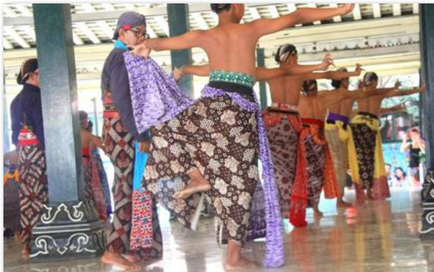
Gambar 14: Abdi Dalem Sedang Melatih Menari

Semua urusan rumah tangga keraton harus dibantu oleh para pengurus keraton yang disebut abdi dalem . Merekalah yang secara ikhlas mengabdikan untuk keraton dan Raja Kasultanan Ngayogyakarta Hadiningrat.