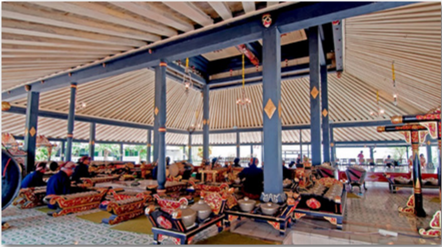
Gambar 5: Bangsal Sri Manganti

Keraton Kesultanan Yogyakarta memiliki berbagai warisan budaya, baik yang berbentuk upacara maupun benda-benda bersejarah. Keraton itu merupakan lembaga adat yang lengkap dengan para pemangku adatnya. Itu sebabnya, pada 1995 Keraton Yogyakarta dicalonkan menjadi salah satu situs warisan dunia oleh Unesco.