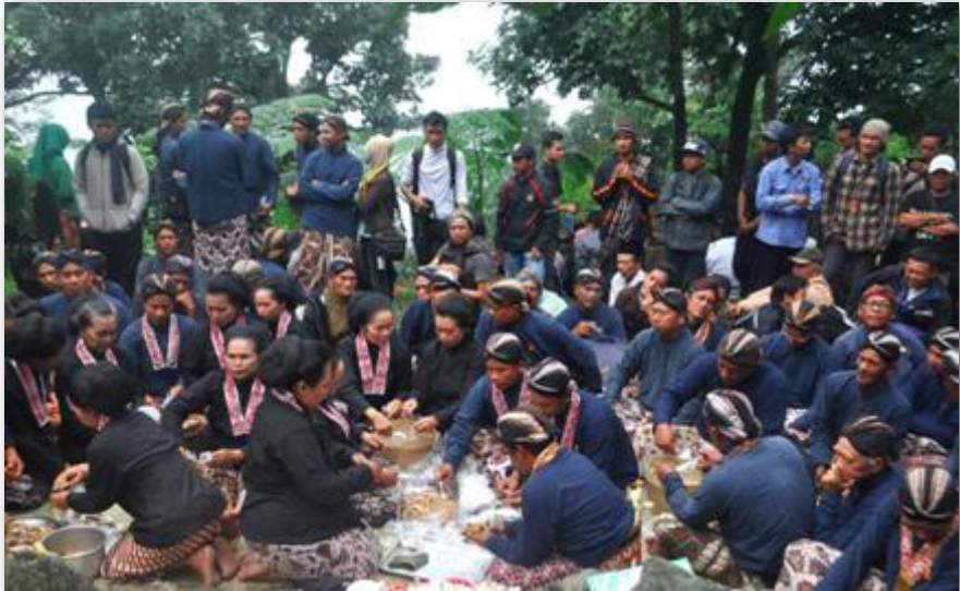
Gambar 18: Para Abdi Dalem pada Labuhan Merapi