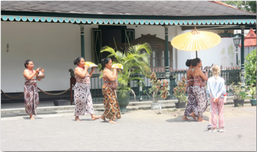
Gambar 12: Abdi Dalem Keparak Membawa Makan Siang untuk Sultan

Jika dilihat dari tugasnya, semua abdi dalem sama-sama mengabdikan kepada pihak keraton dan raja. Yang membedakan adalah pemberian uang kekucuh dari pihak keraton. Abdi Dalem Keprajan tidak mendapatkan uang kekucuh karena mereka mendapatkan uang pensiun, sedangkan Abdi Dalem Punakawan mendapatkan uang kekucuh meskipun jumlahnya sangat kecil.