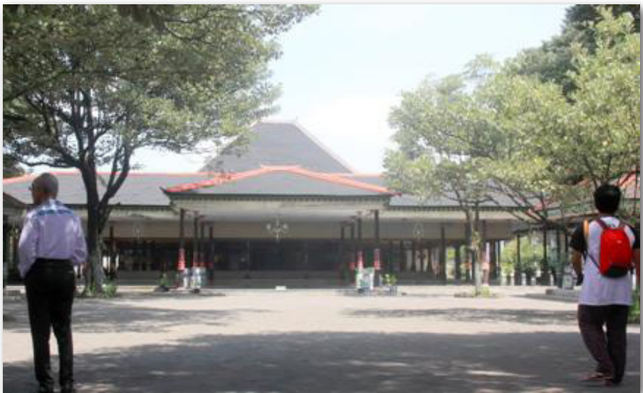
Gambar 6: Bangsal Kencono di Kompleks Kedhaton

Keraton Yogyakarta juga mempunyai bangunan-bangunan yang berada di luar lingkungannya. Bangunan-bangunan tersebut memiliki kaitan yang erat dan bisa jadi merupakan bagian yang tidak terpisahkan. Misalnya, Panggung Krapyak, kompleks pemandian Tamansari, Masjid Gede, Plengkung Gading, dan sebagainya.