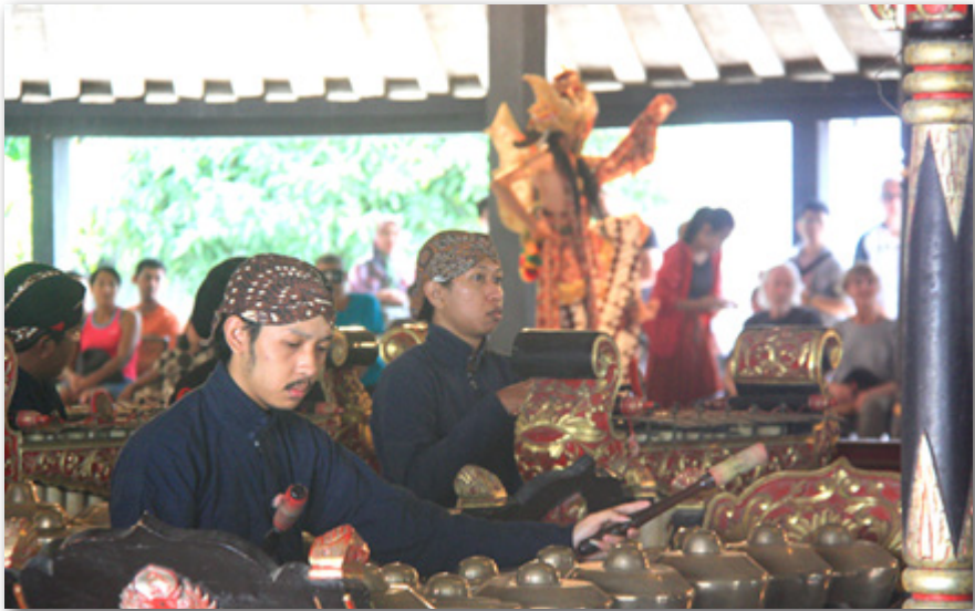
Gambar 16: Abdi Dalem Magang Sedang Menabuh Gamelan

Walaupun syaratnya tidak sulit, namun untuk menjadi abdi dalem beberapa tahapan harus dilalui. Siapa pun yang ingin menjadi abdi dalem harus mendaftarkan diri ke kesekretariatan. Mereka menawarkan bakat, kemampuan, atau minat yang dimiliki. Selanjutnya, setelah disetujui menjadi abdi dalem, mereka harus menjalani magang.