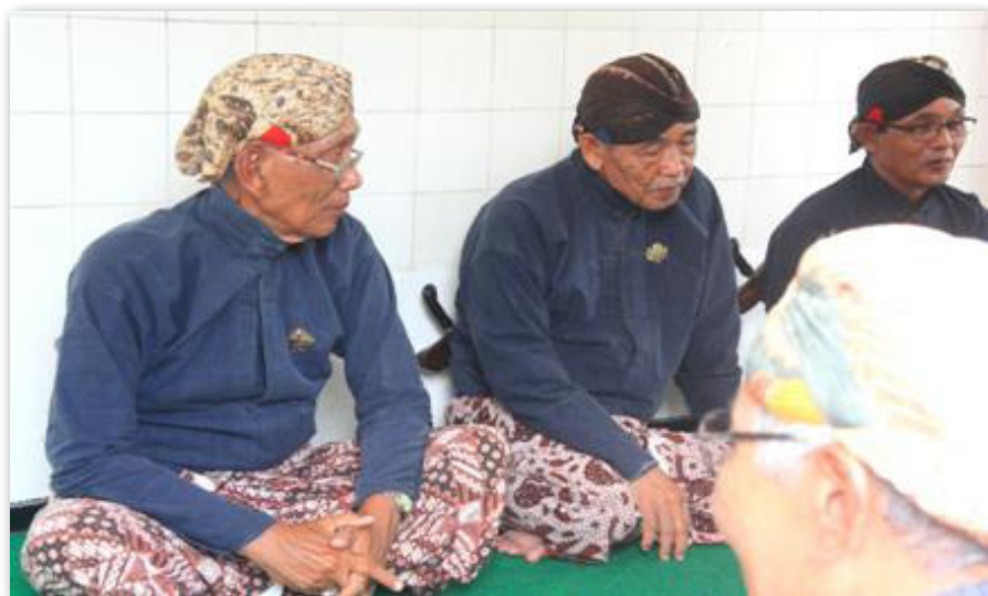
Gambar 9: Para Abdi Dalem Sedang Bercengkrama

Secara garis besar, abdi dalem terbagi menjadi dua golongan, yaitu: Punakawan dan Kaprajan. Abdi Dalem Punakawan merupakan abdi yang berasal dari kalangan masyarakat umum. Mereka adalah tenaga operasional yang menjalankan tugas keseharian di dalam keraton.