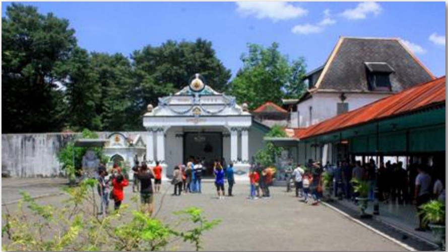
Gambar 4: Pintu Gerbang Donopratopo menuju Kedhaton

Keraton Yogyakarta pada 7 Oktober 1756. Tanggal ini kemudian dijadikan hari berdirinya Kota Yogyakarta.