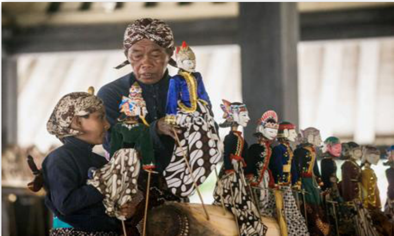
Gambar 26: Selepas Pagelaran Wayang Golek