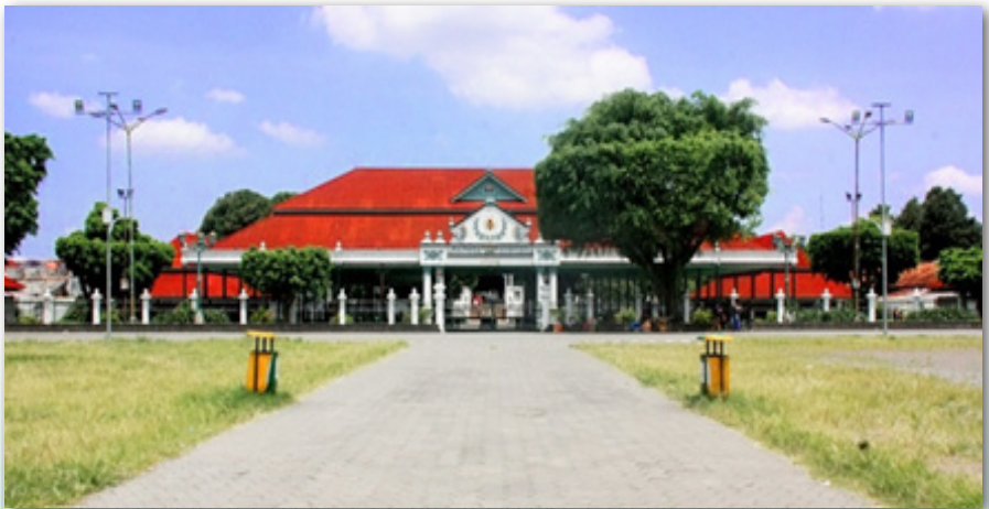
Gambar 1: Keraton Yogyakarta Saat Ini