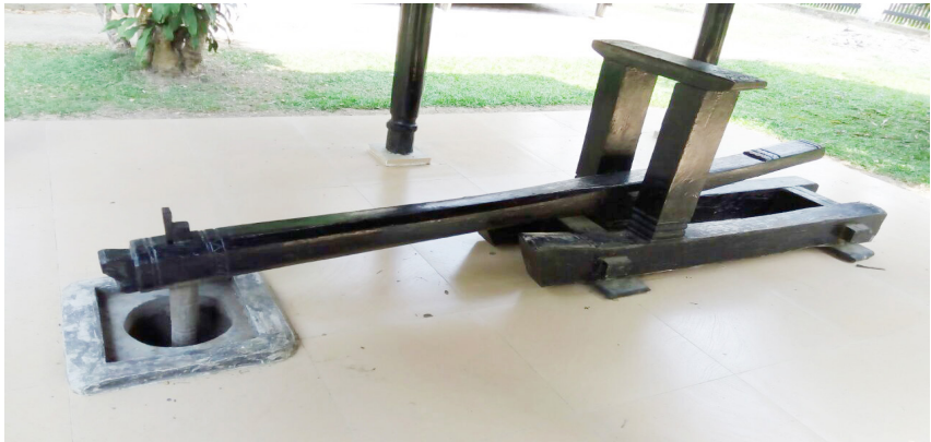
Jeungki/Alat Tumbuk Tradisional Aceh

“Kalau zaman sekarang, Po?” tanya Cut Putroe.