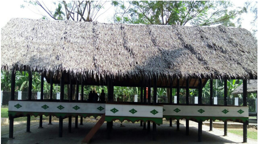
Balee panjang di rumah Cut Meutia.

“Kalau kita tidur di sini sampai malam, boleh, Po?” tanya Popon kepada Bu Ayi.