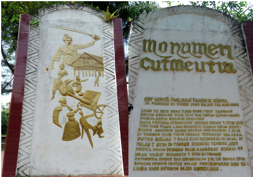
Monumen Cut Meutia

“Monumen Cut Meutia,” Cut Putroe tanpa diminta membacanya dengan suara nyaring.