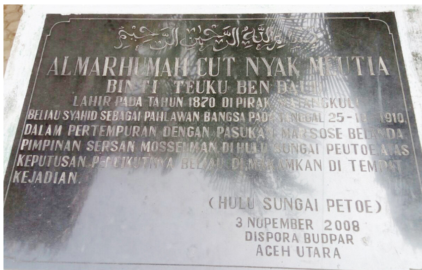
Prasasti yang terletak di dekat tangga rumah.

“Bismillahirrahmanirrahim. Almarhumah Cut Nyak Meutia Binti Teungku Ben Daud. Lahir pada tahun 1870 di Pirak Matangkuli. Beliau syahid sebagai pahlawan bangsa pada 25.10.1910 dalam pertempuran dengan pasukan marsose Belanda pimpinan Sersan Mosselman di hulu Sungai Peutoe. Atas keputusan pengikutnya beliau dimakamkan di tempat kejadian, Hulu Sungai Peutoe, 3 November 2008. Dispora Budpar Aceh Utara.” Popon membaca perlahan. Aku tertegun mendengarnya.