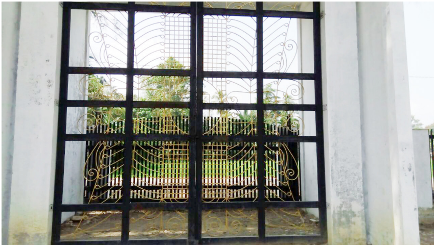
Pintu Pagar Motif Pintu Aceh

“Bu, pintunya tertutup rapat. Apa tidak ada penjaga?” tanya Aini sambil memotret pintu pagar.