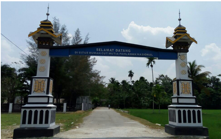
Gerbang Masuk ke Rumah Cut Nyak Meutia

Aku berdiri menatap gerbang besar dan tinggi. Berdiri gagah di jalan desa. Di kiri kanan gerbang berhias hamparan sawah yang luas.