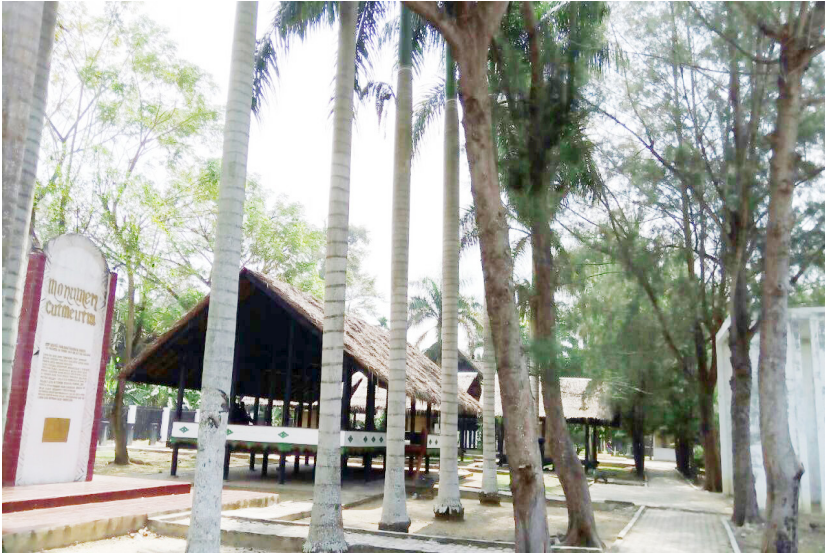
Halaman sangat luas ditanami pohon besar.