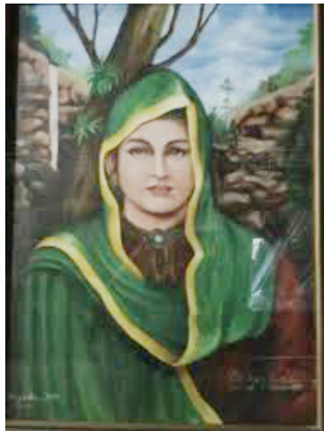
Lukisan Cut Nyak Meutia