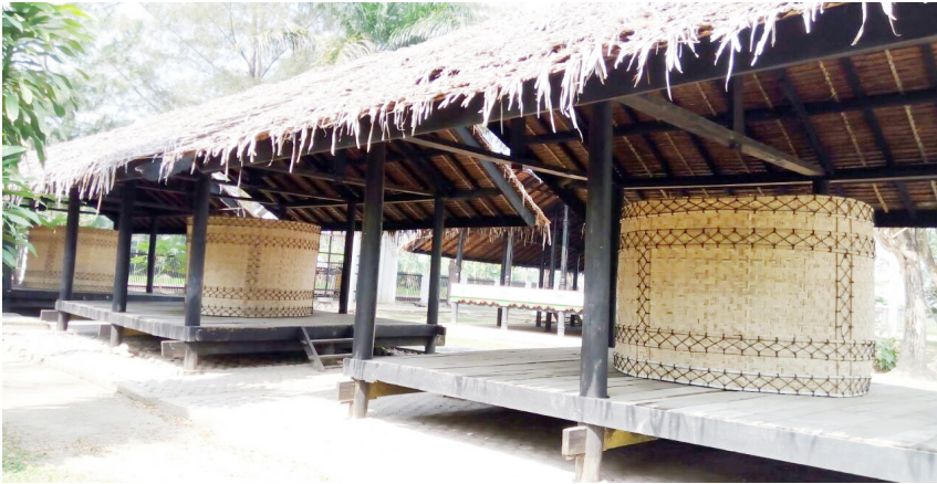
Tiga buah krong padi di rumah Cut Nyak Meutia.

“Benarkah? Jadi tiga lumbung ini berisi padi?” Cut Putroe terheran. Lalu, naik ke rumah-rumahan lumbung. Melihatnya lebih dekat.