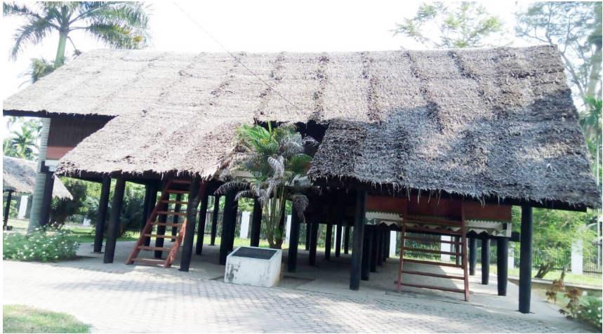
Rumah Cut Nyak Meutia Tampak Depan

Rumah beratap rumbia, berdinding papan. Tameh (tiang) dari kayu meranti diwarnai hitam. Dihiasi ukiran-ukiran tradisional. Rumah itu memiliki dua tangga dan pintu dari arah depan.