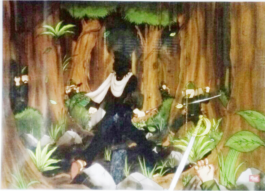
Lukisan karya Saed Art di rumah Cut Nyak Meutia.

“Hus ..., Itu, tu, tu!” aku cuma bisa menunjuk. Mereka terheran-heran. Lalu, aku, dan semua mengikuti Bu Ayi ke arah yang kutunjuk, serambi belakang.