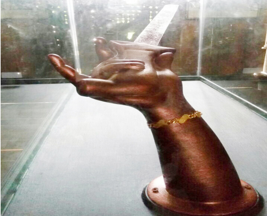
Patung tangan dari perunggu berhias gelang emas.