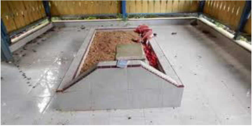
Makam Cut Nyak Meutia