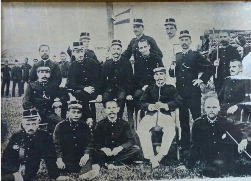
Foto serdadu Belanda di dinding rumah Cut Meutia.

Beberapa foto zaman dahulu tergantung rapi di dinding. Ada banyak foto sejarah, umumnya hitam putih.