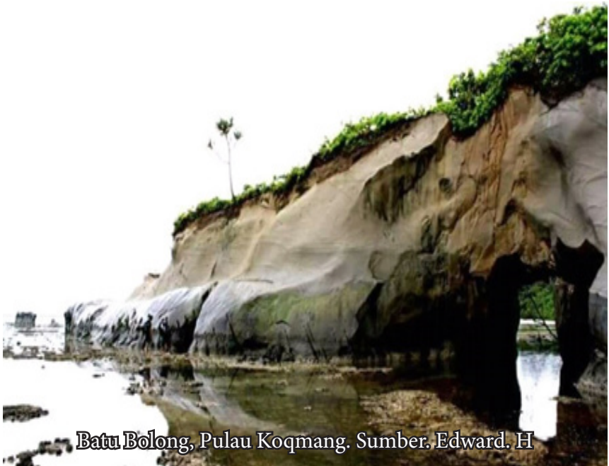
Batu Bolong, Pulau Koq Mang.

Bang Edward sering mengantar wisatawan atau rombongan yang ingin melihat atau mengunjungi lokasi wisata di sekitar pulau Enggano. Tidak begitu lama kami sampai. Dari jauh sudah terlihat pemandangan yang begitu indah. Tebing yang berada di pulau itu dengan lubang-lubang mirip pintu. Sungguh pemandangan yang menakjubkan.