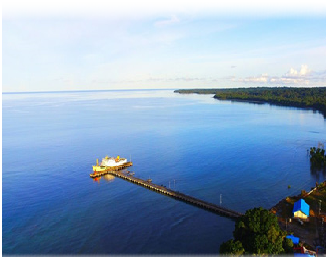
Pelabuhan Malakoni, Pulau Enggano .

tidak menginginkan orang itu kena perihei , kena sakit perut. Orang itu bisa sembuh apabila meminta maaf sama kakek, karena makan di tempat terbuka tanpa basa-basi menawari kakek makan juga,” ujar kakek agak sedih.