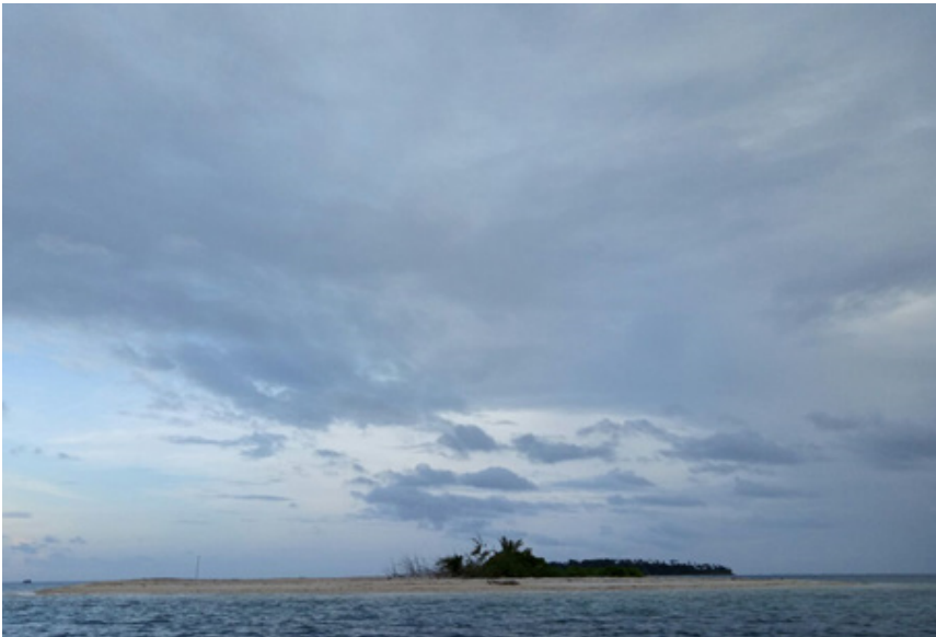
Pulau Bangkai dari kejauhan.

Perahu mulai bergerak meninggalkan muara menuju ke laut lepas. Pagi itu cuaca cerah, tetapi laut sedikit bergelombang.