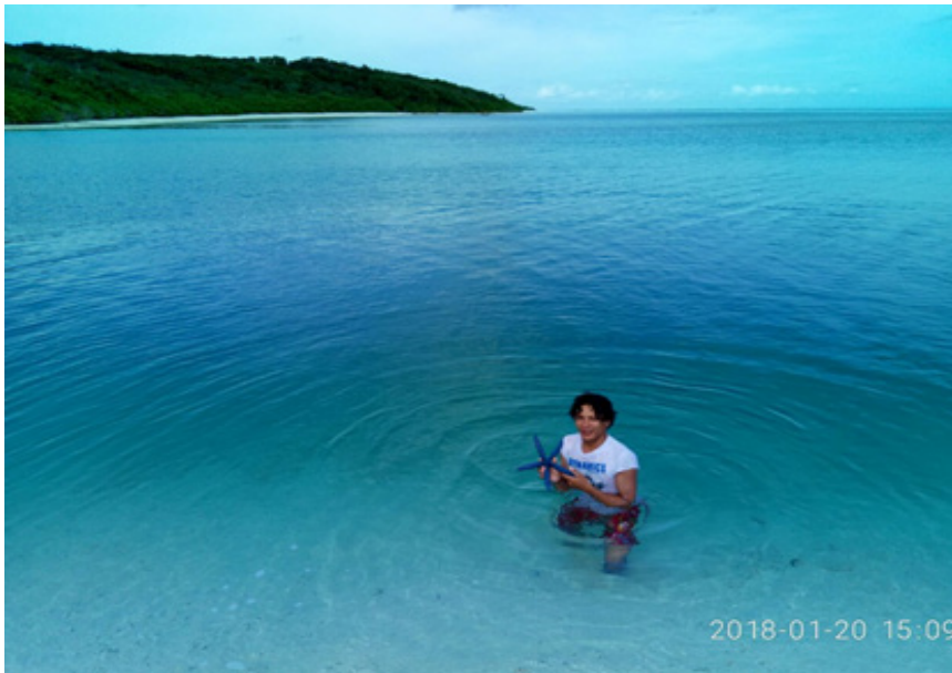
Kolam laut Pulau Padipo.

Lebih dari dua puluh menit menuju Pulau Padipo. Akhirnya, perahu merapat dan mendarat di pantai. Bang Edwar mematikan mesin dan membuang jangkar. Kami harus masuk air karena perahu tidak bisa terlalu ke pinggir. Satu persatu kami turun dari perahu, masuk ke air sebatas lutut. Kadang diterpa ombak membuat celana dan baju basah.