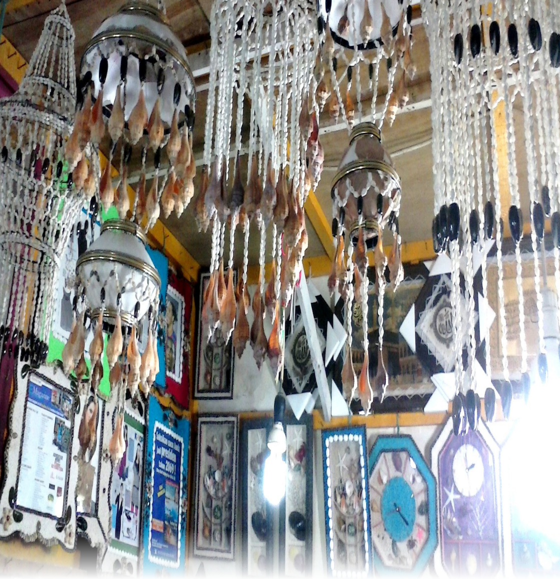
Hiasan dari kerang.