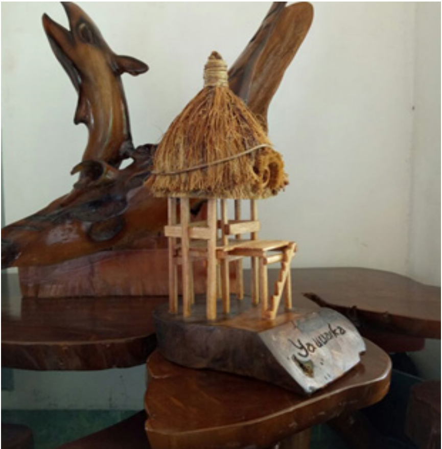
Miniatur rumah adat Enggano.

Sanggar itu milik kerabat Rizal. Ada saung di depan sanggar. Tempat berkumpul anggota sanggar atau tempat belajar seni. Mulai dari seni musik, oleh vokal, tari, dan teater.