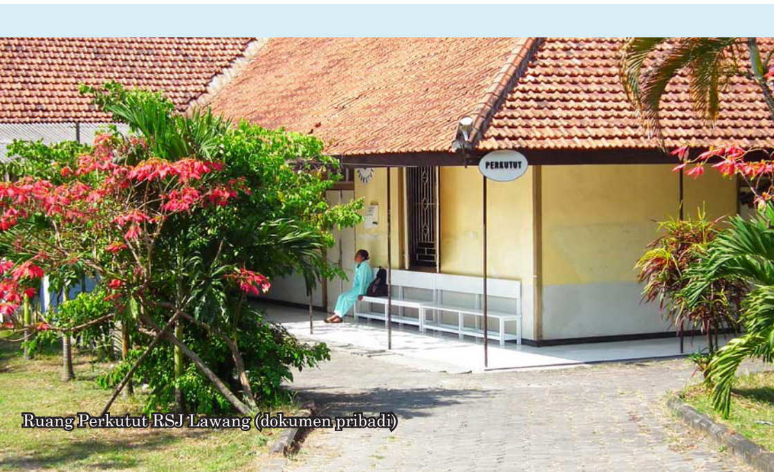
Ruang Perkutut RSJ Lawang

Antara tahun 1929—1935 RSJ Lawang dengan dua bagiannya, yakni RSJ Annex Suko dan Sempu ditangani oleh tujuh orang dokter dan seorang profesor wanita. Di sana tercatat pasien terbanyak, yaitu sejumlah 4.200 pada tahun 1941. Pada waktu itu RSJ Lawang dikembangkan menjadi pusat penelitian otak.