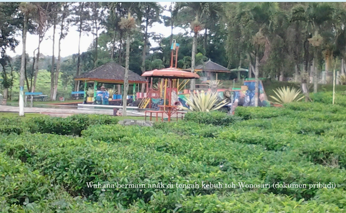
Wahana bermain anak di tengah kebun teh Wonosari

Ayo, jangan lupa ajaklah seluruh keluarga untuk berwisata ke Kebun Teh Wonosari, Lawang yang sekarang dikelola oleh PTPN XII. Dalam waktu- waktu tertentu terdapat acara yang dirancang oleh pengelola untuk menarik pengunjung, misalnya tarian kolosal di kebun teh dan tempat outbond .