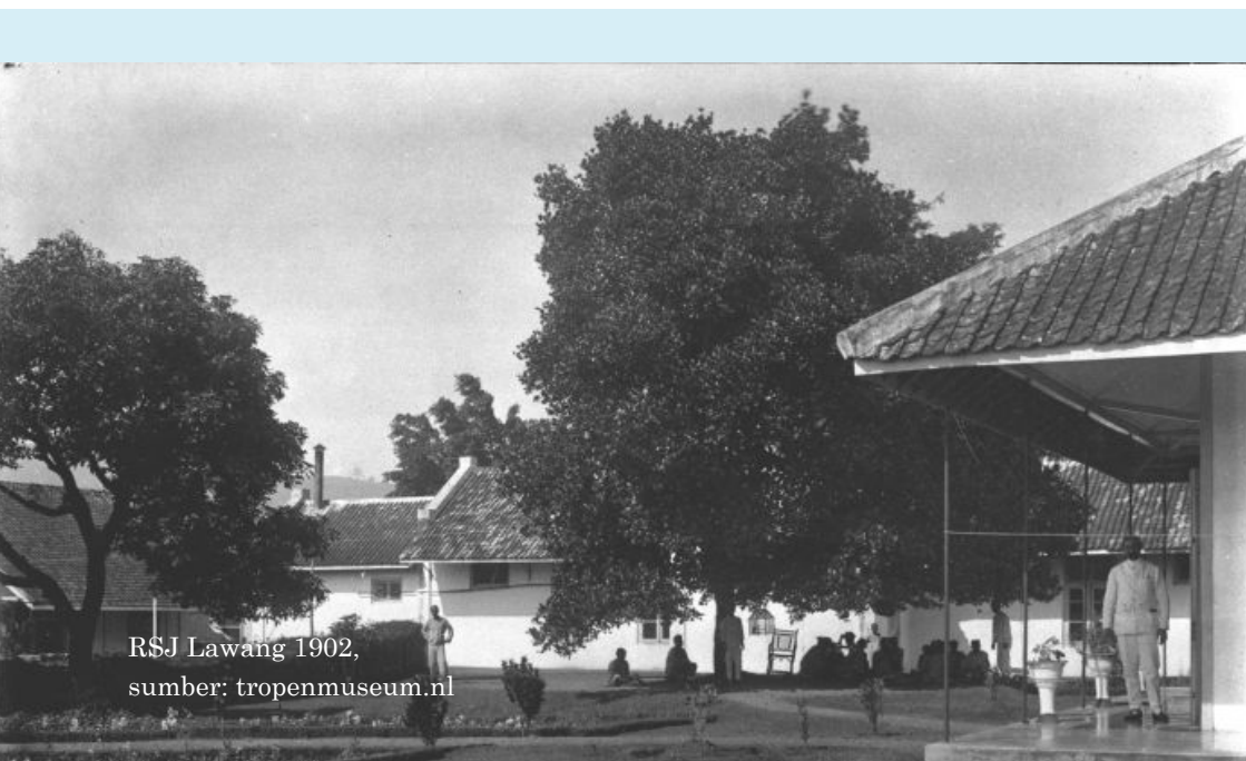
RSJ Lawang 1902

J.P.G. Hulshofftol, direktur ke-3 rumah sakit itu kemudian mengajukan adanya perluasan rumah sakit kepada Departemen Van Onderwijs en Eeredienst . Dia mengajukan perluasan karena keadaannya mendesak pada saat itu. Pada tahun 1909 saja sudah ada 1.171 pasien dengan gangguan jiwa, terutama orang-orang Belanda dan Tionghoa. Beberapa ratus orang di antaranya malah dititipkan ke penjara-penjara.