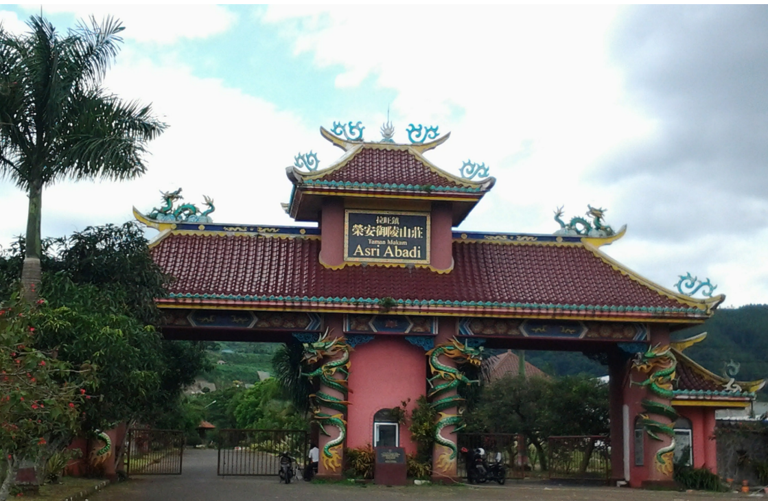
Gerbang Taman Makam Asri Abadi Lawang

Di Desa Wonorejo terdapat makam Sentong Baru dan Sentong Raya. Makam pertama ini mulai dibuka sekitar tahun 1977. Selanjutnya terdapat makam yang bernama Asri Abadi yang areanya meliputi dua desa, yakni di Desa Srigading dan Sidodadi.