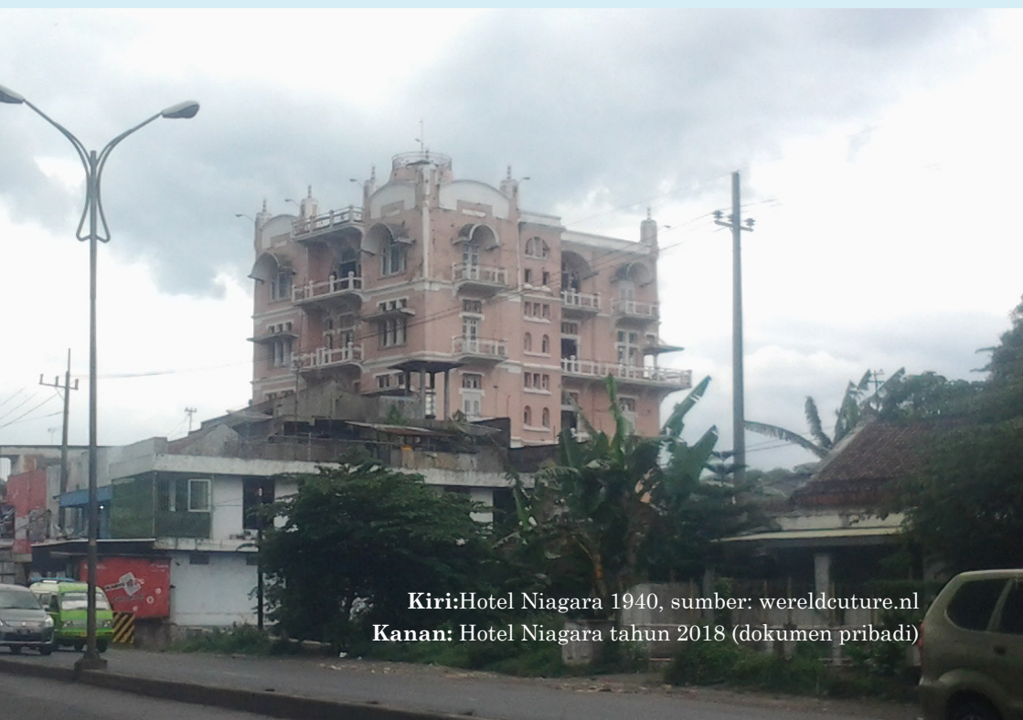
Kiri: Hotel Niagara 1940, sumber: wereldecuture.nl Kanan: Hotel Niagara tahun 2018 (dokumen pribadi)

Empat tahun kemudian, atau tepatnya pada tahun 1964 vila itu sedikit direnovasi dan difungsikan sebagai hotel. Hotel Niagara namanya. Hotel yang menyimpan banyak kenangan dengan interior yang menawan.