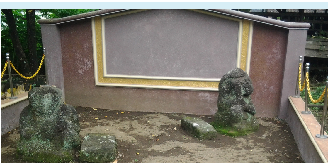
Arca peninggalan Majapahit di Tegalrejo, Ketindan

Kini Lawang berubah menjadi kota strategis yang ramai. Pasarnya menjadi tempat transit berbelanja untuk orang-orang yang baru saja menyelesaikan darmawisata di sekitar Malang Raya. Tempat makan dan toko oleh-oleh bermunculan. Bahkan, beberapa perusahaan obat dan kimia besar dibangun di kota ini.