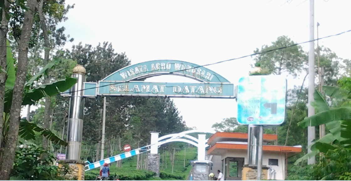
Pintu masuk Kebun Teh Wonosari Lawang (dokumen pribadi)

Sebenarnya pada saat kolonial, komoditas perkebunan bukan hanya teh yang terdapat di Lawang, melainkan kopi dan kina juga pernah ditanam di sepanjang arah lereng Gunung Arjuno. Misalnya, dulu Dusun Gebuk adalah area perkebunan kopi Belanda yang cukup luas. Namun, pada era pendudukan Jepang banyak varietas kopi dan teh yang ditebang.