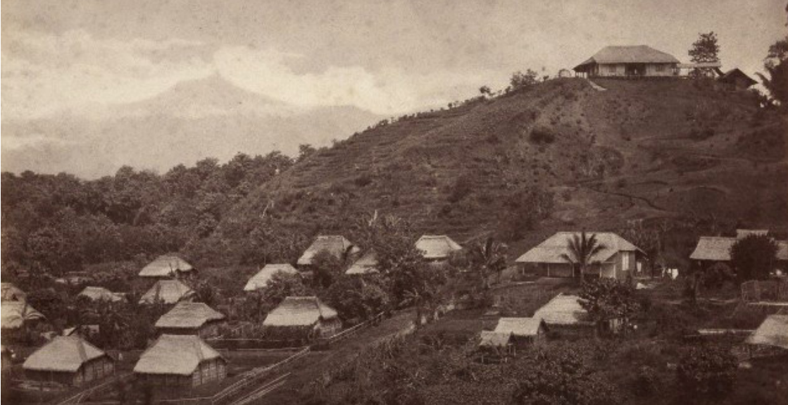
Kebun kopi Gebuk 1900

NV Cultuur Maastchappij adalah perusahaan Belanda yang mulai mendirikan kebun teh di area Kecamatan Wonosari ini pada tahun 1875. Pada tahun 1910 hingga tahun 1942 sebagian lahan kebun teh tersebut ditanami pohon kina. Pohon yang dapat dijadikan obat malaria itu memang merupakan komoditas yang laku di pasaran dunia kala itu.