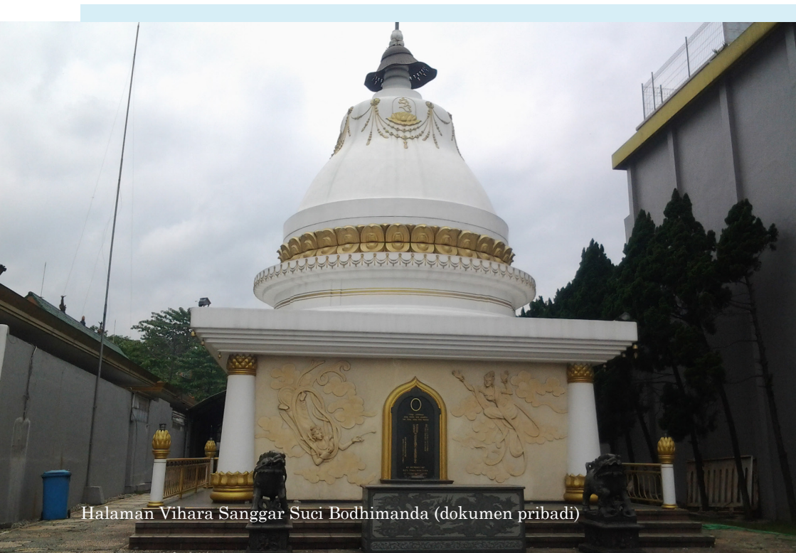
Halaman Vihara Sanggar Suci Bodhimanda (dokumen pribadi)

Tempat beribadah orang Buddha tersebut masih digunakan sebagai persembahyangan setiap hari. Pada waktu-waktu tertentu terdapat acara yang dihadiri oleh banyak pengikutnya yang berada di kota-kota lain di luar Lawang.