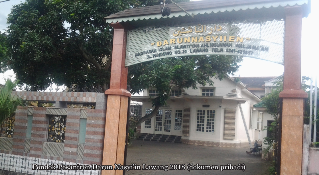
Pondok Pesantren Darun Nasyi'in Lawang 2018

Sementara itu, gereja juga banyak ragamnya di Lawang. Tentu, sebagai daerah yang dahulu banyak dihuni oleh orang-orang Belanda, terdapat banyak gereja di tempat ini. Salah satunya adalah Gereja Protestan Indonesia Bagian Barat (GPIB) Pelangi Kasih yang terletak di Jalan Thamrin.