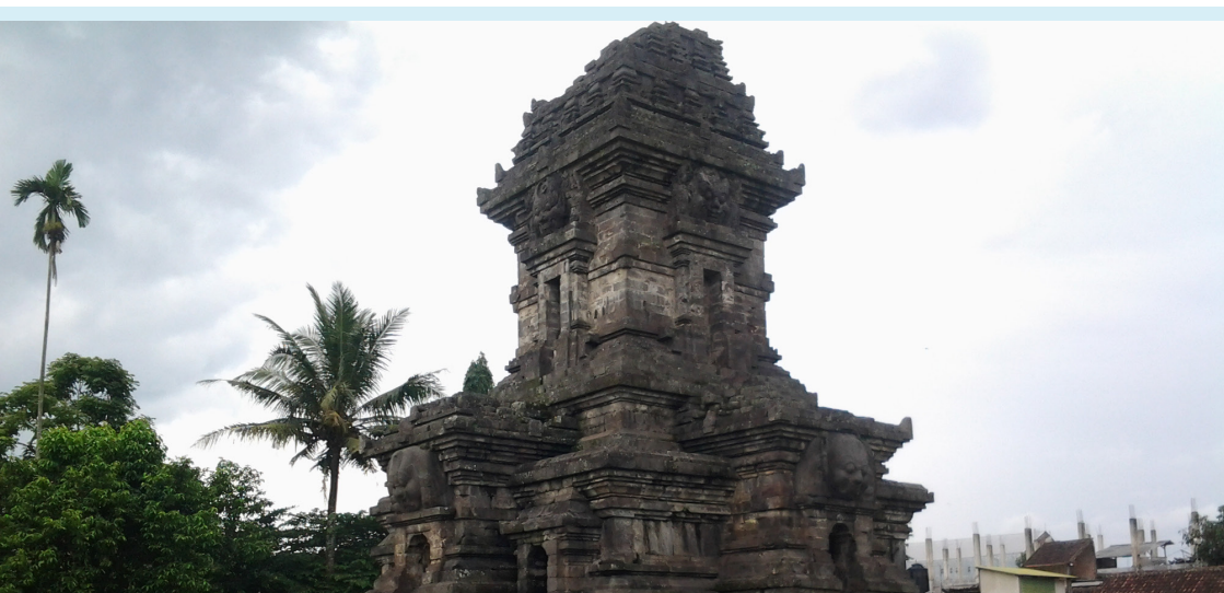
Candi Singosari 6 km Selatan Lawang (dokumen pribadi)

Krama śubhakāla mangkat ahawan banu hangêt I banir muwah talijungan, amgil i wêdhwawêdwan irikang dina mahāwan I kûwarahã ri cêlong, mwan i dadamar garantang i pagêr talaga pahanangan têkekha dinunung.