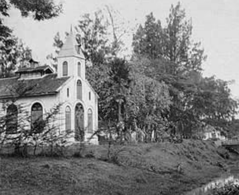
Atas: GPIB 1942, sumber: kitlv.nl Bawah: GPIB Pelangi Kasih 2018 (dokumen pribadi)