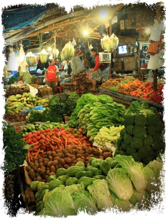
Di pasar terdapat orang-orang yang berasal dari berbagai daerah

Ibu sibuk berkeliling dan memilih-milih barang yang akan dibeli. Setelah itu, ia menawar, membayar, dan memasukkan barang belanjaan ke keranjang.