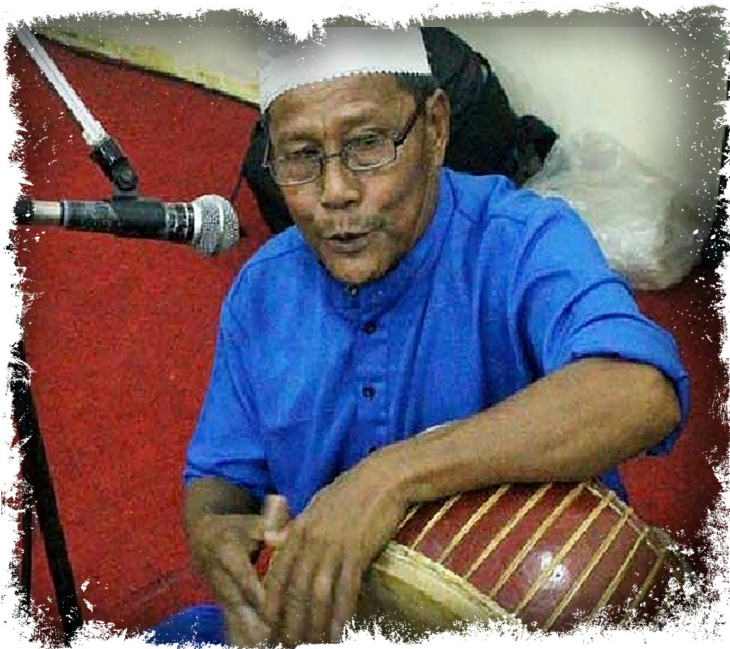
Pertunjukan tradisi lisan menggunakan bahasa daerah

Paman Fauzan tertawa, “Abidzar, seminggu yang lalu kita sudah bicara tentang bahasa daerah di rumah Paman. Masih ingat, ‘kan?”