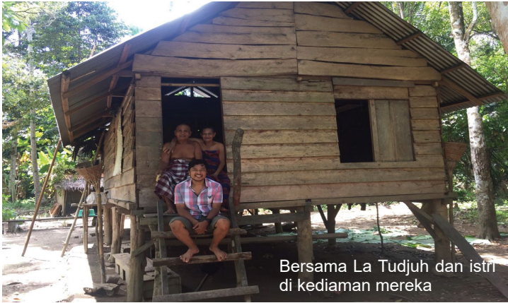
Bersama La Tudjuh dan istri di kediaman mereka