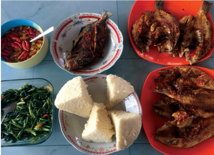
Colo-colo (kiri atas) dan suami (tengah bawah)