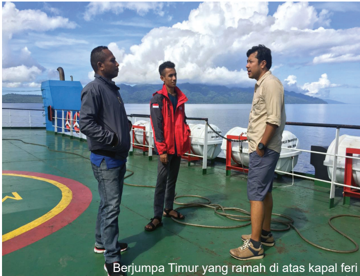
Berjumpa Timur yang ramah di atas kapal feri