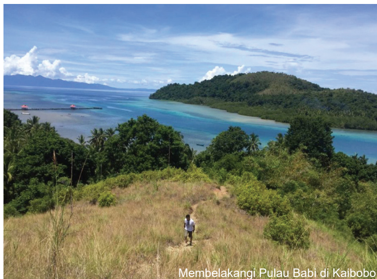
Membelakangi Pulau Babi di Kaibobo