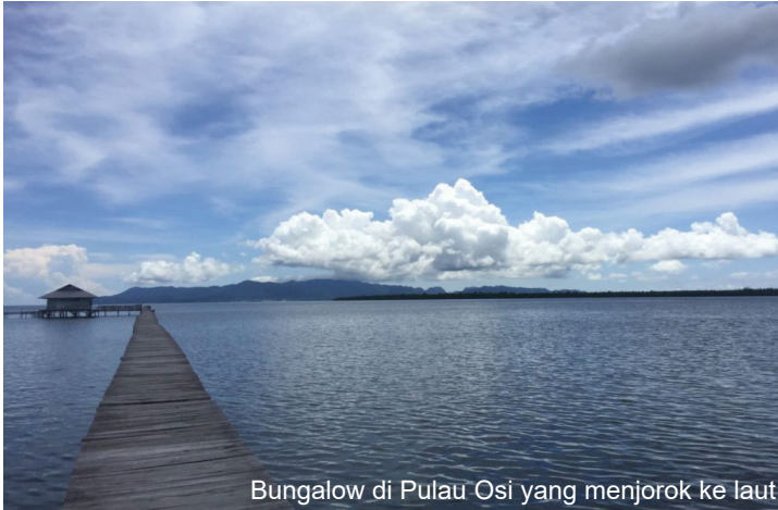
Bungalow di Pulau Osi yang menjorok ke laut