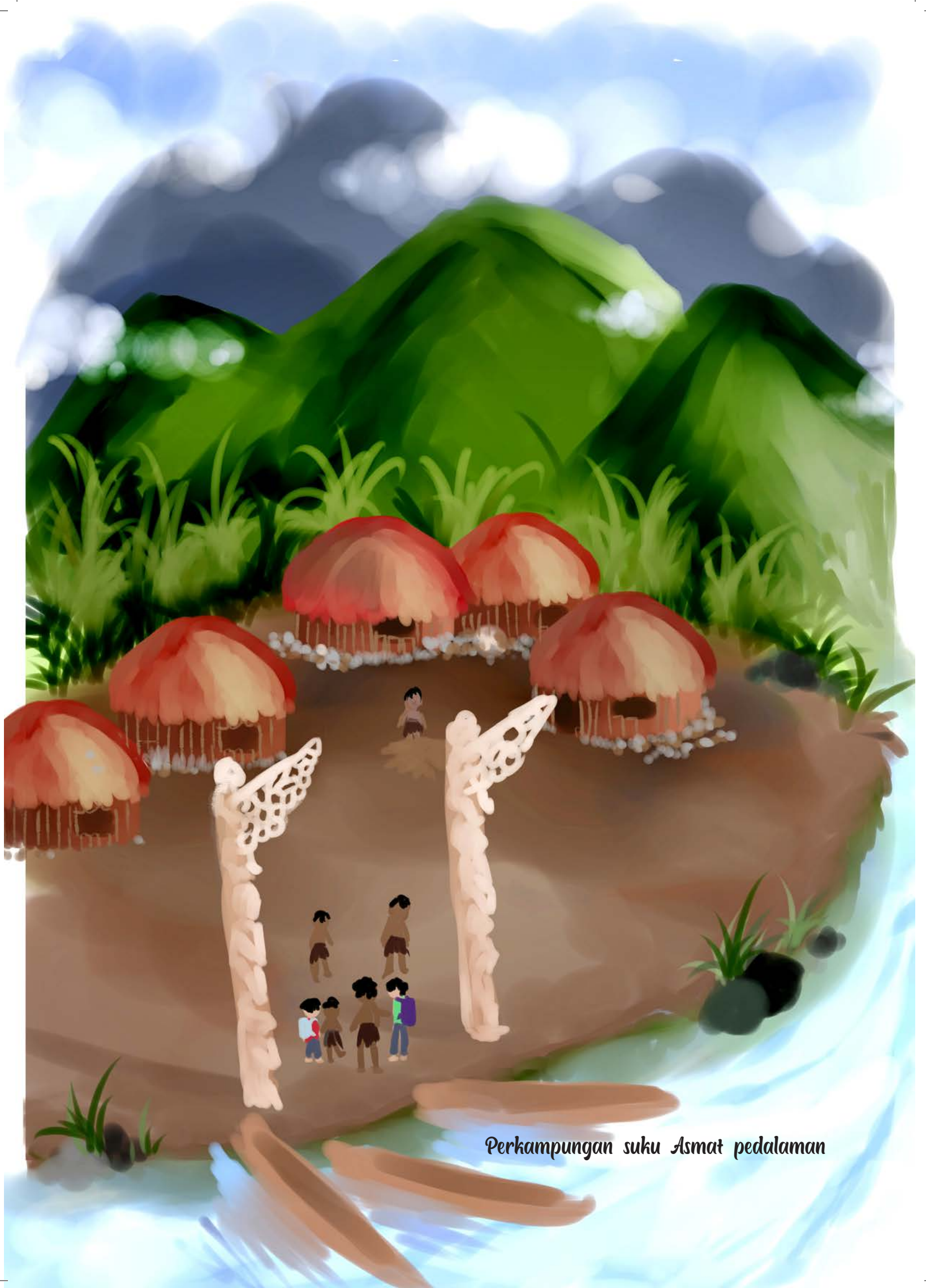
Perkampungan suku Asmat pedalaman