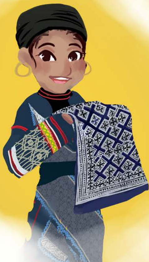
Proses membuat batik suku Mong Hitam