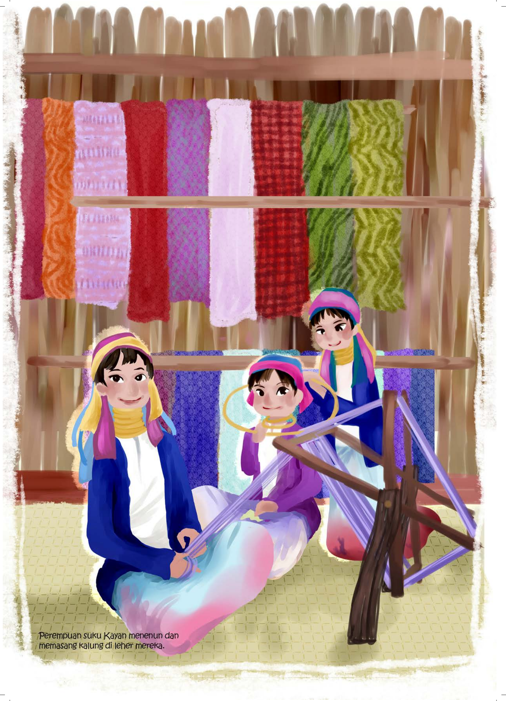
Perempuan suku Kayan menenun dan memasang kalung di leher mereka.