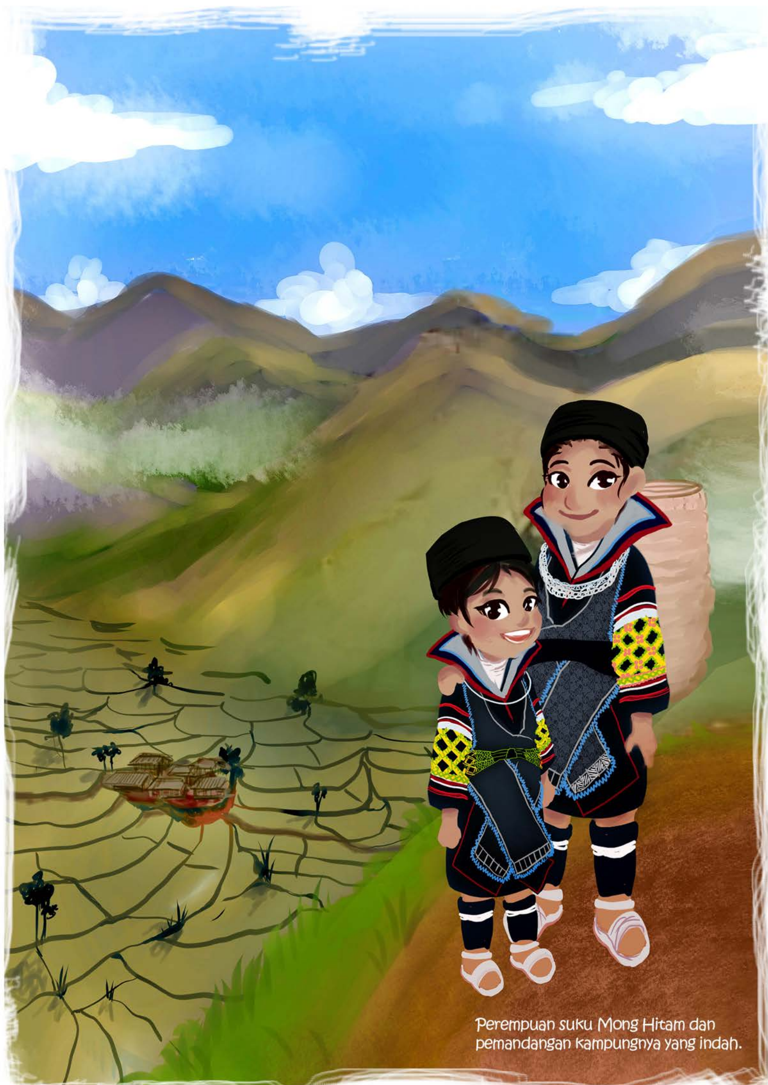
Perempuan suku Mong Hitam dan pemandangan kampungnya yang indah.