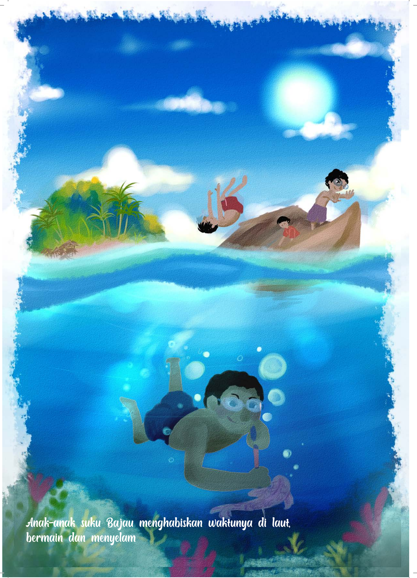
Anak-anak suku Bajau menghabiskan waktunya di laut, bermain dan menyelam