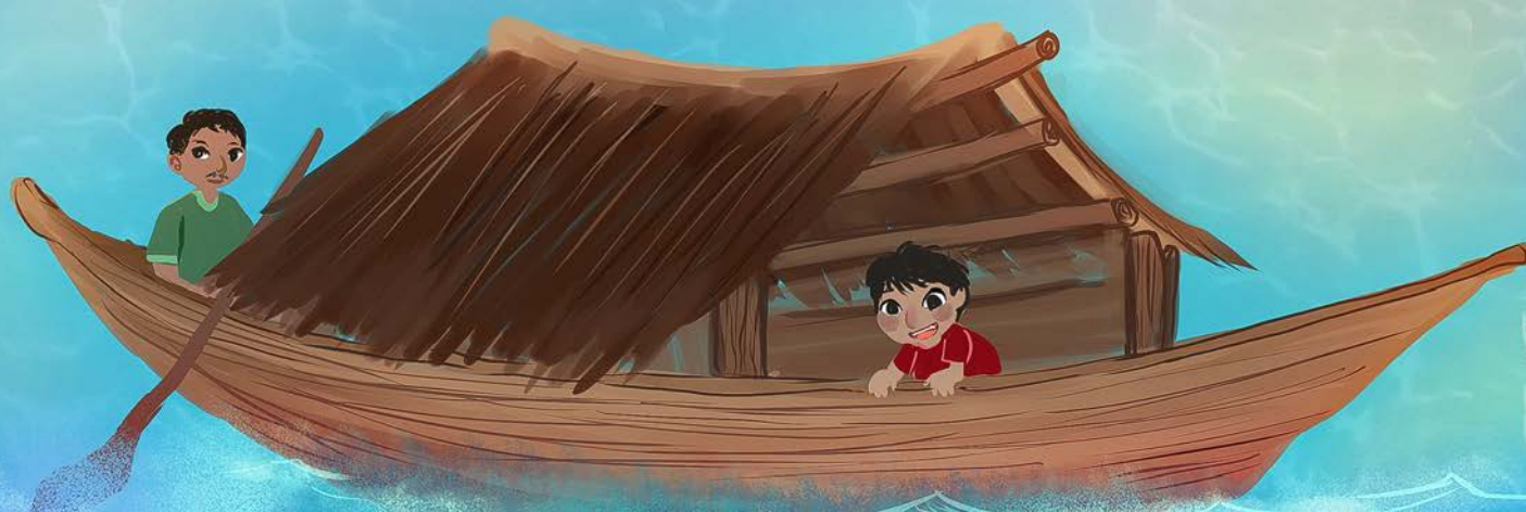
Lepa atau Rumah Perahu Suku Bajau.

“Tidak lama lagi, mungkin tidak akan ada lepa lagi di Bajau ini. Mereka akan selalu