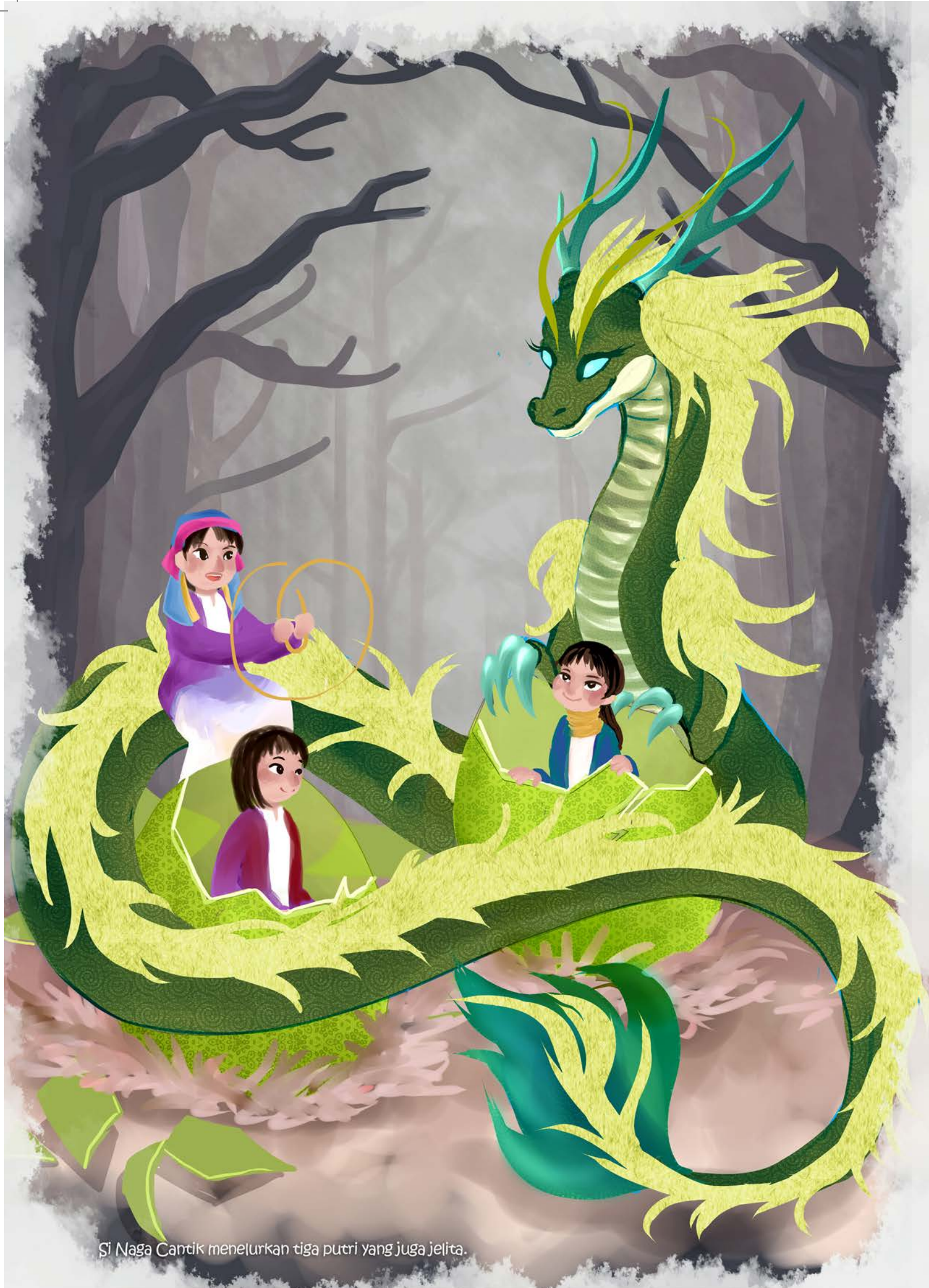
Si Naga Cantik menelurkan tiga putri yang juga jelita.